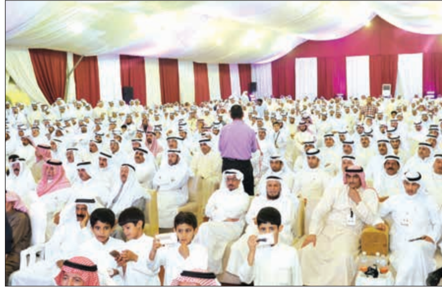
ناخبو الدائرة الأولى خلال الندوة