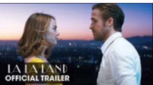
مشهد من الفيلم

هوليوود - وكالات: يتنافس فيلم «Lala land» بقوة على عدد من جوائز الأوسكار في الحفل المتوقع اقامته بداية العام المقبل. ويعتبر الفيلم الأوفر حظا في الحصول على 12 جائزة منها أحسن فيلم، أحسن ممثل، أحسن ممثلة، وأحسن أغنية. الفيلم رومانسي موسيقي كوميدي - درامي تدور أحداث القصة حول موسيقي شاب وممثلة طموحة يقعان في الحب في مدينة لوس أنجليس. «Lala Land» من تأليف وإخراج داميان تشازل، وهو من بطولة رايان غوسلينغ وإيما ستون، إضافة إلى جي كي سيمونز وروزماري ديويت.