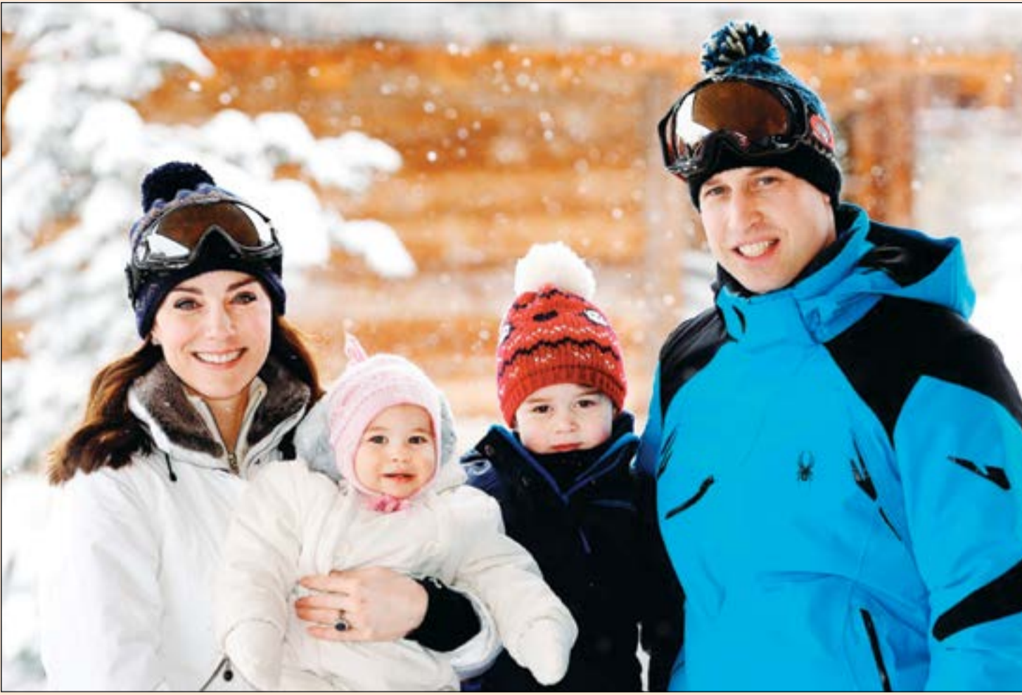
وليام وكيت والابن جورج والابنة شارلوت