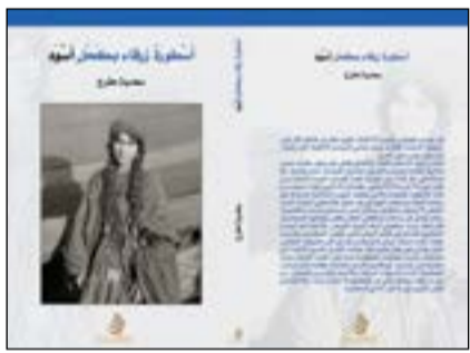
غلاف كتاب «أسطورة زرقاء بكحل أسود»