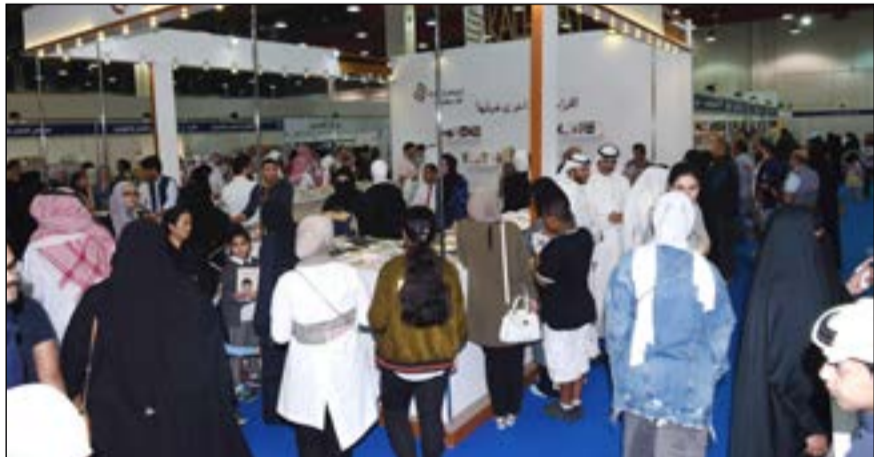
إقبال من الجماهير على زيارة معرض الكويت الدولي للكتاب

عشاقهم! ورحلت جدتي في بدايات مراهقتي، لكن شغفي بعوالمها المسحورة ظل دائما يراود سكوني أمام الورق الأبيض، ولاحقا أمام لوحة المفاتيح، فانساق في خضم السحر لكي تكون الحكاية كلمة ونغما، حذاء حزينًا، ورحة تدور وتدور وتدور على محورها المغني، وتقول جدتي إنهن كن يغنين وهن يطحن القمح، فتفسر الأغنية تقفد جراتها والتي لم تكشفها إلا مؤخرًا جدا، وأنا أتحاشى مقص الرقيب فيما أنشر، لا فيما أكتب».