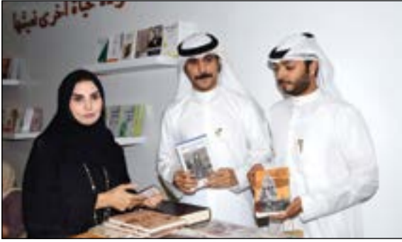
مفرح في صورة مع اثنين من قرائها