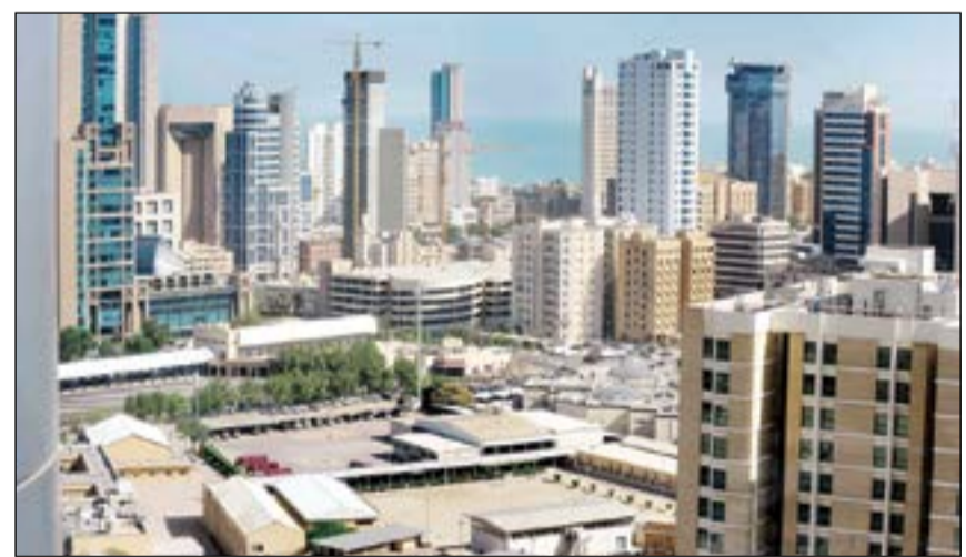
قوانين منع الأجانب في الكويت من تملك العقارات حددت من الاستثمار الأجنبي فضلا عن شح السيولة