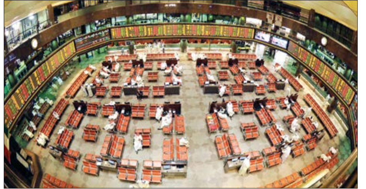
تراجع الثقة بالأسهم قاد إلى تراجع استثمارات الصناديق