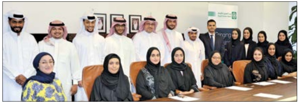
المدربون مع مسؤولي «بيتك»

كذلك يمكن للعملاء التمتع بالمزايا الإضافية التالية التي تتضمن: الحصول على بطاقة سحب آلي، الحصول على بطاقة ائتمان بضمان الحساب، الحصول على كل خدمات البنك التجاري المصرفية. ويتضمن البرنامج الجديد لجوائز حساب النجمة سحوبات ربع سنوية تتيح للعملاء الفوز بجوائز كبرى هي: 100 ألف دينار، و250 ألف دينار، و500 ألف دينار، و«التجاري» ينتهز هذه الفرصة ليهني جميع الفائزين في سحب النجمة، علماً أنه سيتم قيد الجوائز النقدية بحسابهم في البنك، كما نتوجه بالشكر لوزارة التجارة والصناعة على تعاونها الدائم وإشرافها الفعال على عمليات السحب التي تمت بسلاسة ونظام.