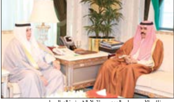
سمو نائب الأمير وولي العهد مستقبلاً الشيخ خالد الجراح

الدفاع الشيخ خالد الجراح. كما استقبل سمو نائب الأمير وولي العهد الشيخ نواف الأحمد بقصر السيف صباح أمس وزير الإعلام ووزير الدولة لشؤون الشباب الشيخ سلمان الحمود ووزير الدولة لشؤون مجلس الوزراء الشيخ محمد الخالد.