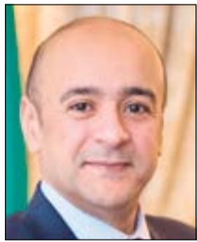
السفير جاسم البديوي

ولفت إلى التطور «البارز» في علاقة قطر كعضو في مبادرة اسطنبول للتعاون مع حلف شمال الأطلسي خلال السنوات الماضية حيث بدت ملامحه في الزيارة المتبادلة بين المسؤولين من الجانبين على أعلى المستويات. وأكد حرص بلاده على المشاركة «الفاعلة» في دعم وتعزيز مجالات التعاون بين دول مبادرة اسطنبول وحلف الناتو، موضحا انها شاركت في معظم الفعاليات السياسية والعملية التي تم تنظيمها.