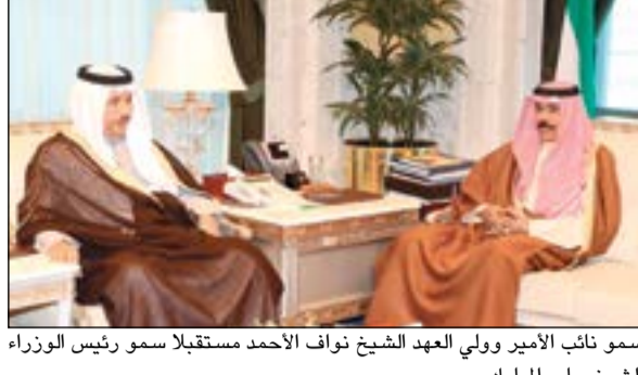
سمو نائب الأمير وولي العهد الشيخ نواف الأحمد مستقبلاً سمو رئيس الوزراء الشيخ جابر المبارك

الدفاع الشيخ خالد الجراح. كما استقبل سمو نائب الأمير وولي العهد الشيخ نواف الأحمد بقصر السيف صباح أمس وزير الإعلام ووزير الدولة لشؤون الشباب الشيخ سلمان الحمود ووزير الدولة لشؤون مجلس الوزراء الشيخ محمد الخالد.