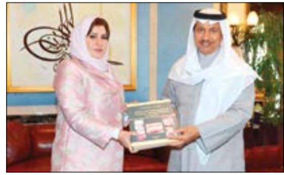
سمو رئيس الوزراء الشيخ جابر المبارك يتسلم الكتاب من د. مريم الشمري

الكبيرة في عطاء الشباب الذين أنبتوا تفوقهم في كل المجالات وكانوا دائما على قدر المسؤولية وعلى مستوى التحديات.