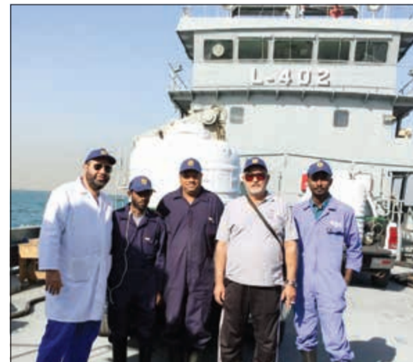
المشاركين في عملية إطلاق الأسماك

العامة لخفر السواحل بواسطة حاملة الجنود والعتاد وسفينة الأنزال (السيف) التابعة لقاعدة محمد الأحمد البحرية في الجبيل، وذلك بمشاركة قيادة أمن الحدود البحرية بوزارة الداخلية. وذكر انه تم الإطلاق بالتعاون مع كل من الإدارة