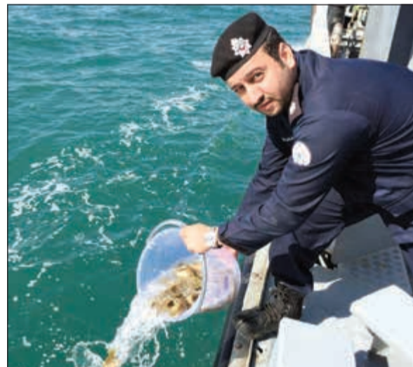
جانب من عملية إطلاق السمك في المياه