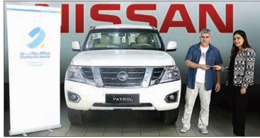
الفائز يتسلم السيارة

يقدمها لهم بشكل دائم. وأوضح البنك أنه يمكن فتح حساب «الثريا» للراتب، والحصول على القروض، وبالدينار الكويتي، أو غيره من العملات، وأنه يمنح صاحبه العديد من المميزات، ومنها الحصول على القروض، وبطاقة السحب الائتماني.