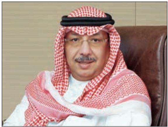
الشيخ محمد الجراح الصباح

للتحولات العربية.. الإصلاحات ودور المصارف».