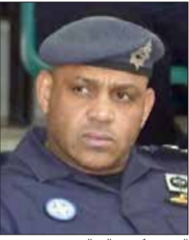
العميد ركن صالح العنزي

المدني ايضا، كما ضبط امن الفروانية أيضا مدينا بـ 14,700 دينار. من جهة أخرى ألقى رجال امن الفروانية القبض على مصري كان في حالة غير طبيعية وعثر بحوزته على كيس شفاف به هيروين. كما ضبط مدين بـ 18 ألف دينار، ومواطن مطلوب للسجن 5 سنوات وعثر بحوزته على شبو وكيس به بقايا شبو.