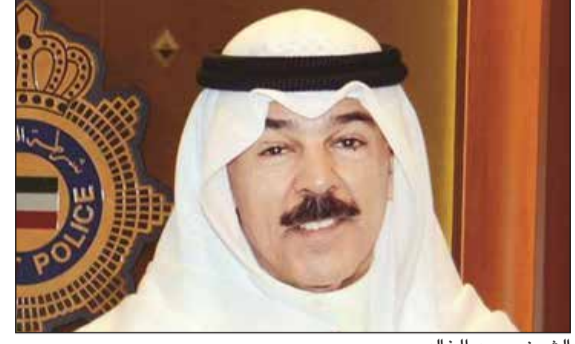
الشيخ محمد الخالد