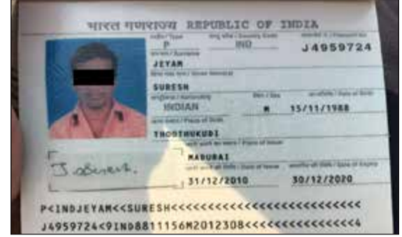
بطاقة الجنني عليه

في الفحيحيل قطعة 10، ولدى توجه رجال الأمن إلى موقع البلاغ شوهدت جثة تعود لهندي من مواليد 1988، وكانت تسيل منه الدماء، وبسؤال عمه (هندي