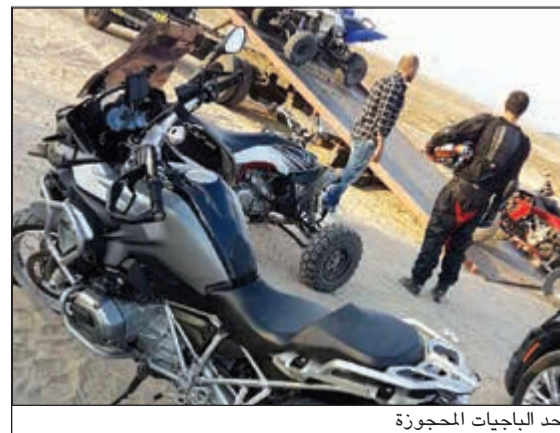
أحد الباجيات المحجوزة

تلقت غرفة عمليات حولي بلاغا بوقوع حالة دهس في شارع يثرب، وتم توجيه إحدى الدوريات إلى موقع البلاغ، وشوهد سوري مصاب وتم إسعافه إلى مستشفى مبارك. وأقال أحد شهود العيان بأن الداهس كان