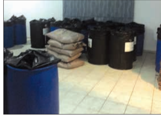
البراميل وأدوات التصنيع تمت مصادرتها