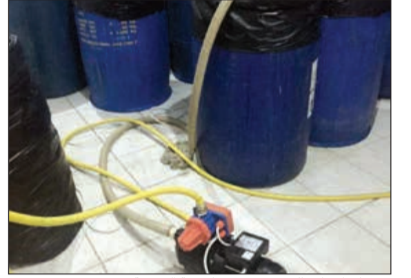
تعديدات لتقطير الخمر تدور في أرضية القسيمة

مداهمة المصنع الذي تم ضبط به نحو 5 آلاف بطل خمر محلي وبراميل وأدوات تقطير كما ضبط الشخص المصنع الذي أحيل إلى الحجز لاستكمال التحقيق. وأكد المصدر أن المتهم حاول الهرب وأبدى مقاومة وقت ضبطه إلا انه فشل وتم التحفظ على المضبوطات.