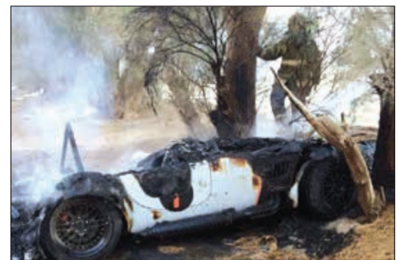
الدار التهمت المركبة

بلاغ ثالث لغرفة عمليات الإطفاء يفيد باندلاع حريق مركبة داخل مزرعة، وعلى الفور تم توجيه فرقة إطفاء الفورة قسم (أ) إلى حريق مركبة في منطقة مزارع الفورة خلف احد المطاعم المعروفة وعند وصول الفرقة وجدت المركبة مشتعلة.