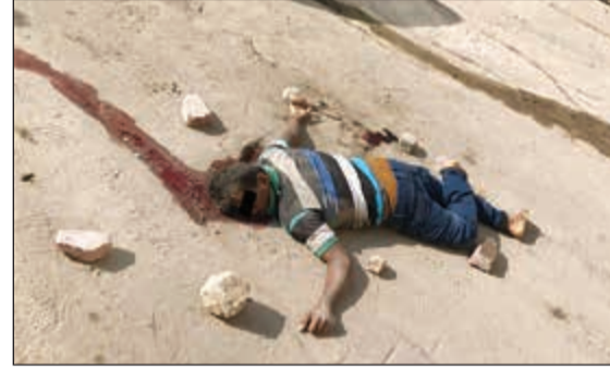
جثة الجنني عليه أحييت إلى الطب الشرعي