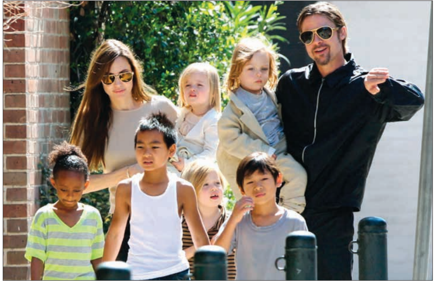
عائلة جولي بيت

وكالات: يعيش أطفال الغنائي براء بيت وأنجلينا جولي الذين انفصلا مؤخرا حالة من الحزن الشديد بسبب رفض والدتهم قضاء والدهم عيد الشكر الموافق 24 الجاري والذي سيقتضونه للمرة الأولى من دون والدهم، وصرح مصدر مقرب للنجمين: «براء بيت والأطفال منزعون من عدم قضائهم عيد الشكر معا، ويحاول الغنائي جولي وبيت أن يناقشا هذا الأمر من خلال مساعديهما، لكن جولي مصممة على أن الأطفال سيقتضون العيد معها، بينما يطالب بيت منها أن يعوضهم عن ذلك اليوم، كما أنهم مازالوا يتوسلون لجولي وبيت أن يرجعا للعيش معا وألا ينفصلا لكن جولي أكدت لهم أن هذا الأمر لن يحدث أبدا، وكان مكتب التحقيقات الفيدرالي «FBI» براء بيت من تهمة الإساءة لأطفاله وضرب ابنه «مادوكس» وإغلاق القضية تماما، وذلك بعد التحقيق في الواقعة إثر نشوب مشاجرة قوية بينهما على الطائرة.