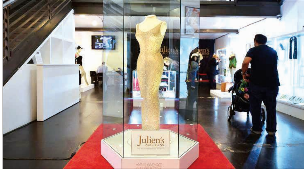
فستان مارلين مونرو

لوس أنجليس - أ.ف.ب: بيع فستان ضيق شهير جدا ارتدته مارلين مونرو عندما غنت للرئيس الأميركي جون كينيدي بمناسبة عيد ميلاده الخامس والأربعين، بسعر 4,8 ملايين دولار خلال مزاد جرى مساء ال ميس في بيغرفي هيلز. وكان الفستان العسكري اللون المرصع بـ 2500 بلورة يقدر بسعر يراوح بين مليونين وثلاثة ملايين دولار من قبل دار «جوليينز أوكشنز» للمزادات التي نظمت عملية البيع في هذا الحي الراقي في لوس أنجليس. وكان الفستان ضيقا الى حد اضطر فيه الخياطون الى حياكته على جسم الممثلة الشهيرة مباشرة قبل اعتقالها المنصة في ماديسون سكوير غاردن في نيويورك في 19 مايو 1962 لتغني «هابي بيرنثاي مستر بريديانت» بصوتها المخير.