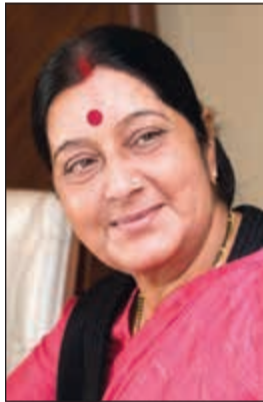
وزيرة الخارجية الهندية

كلية واحدة فقط للبقاء حيا. وعبر الكثير من مستخدمي مواقع التواصل الاجتماعي عن استعدهم للتبرع بأحد الكليتين وبسرعة، ويضع مستخدمي وسائل التواصل الاجتماعي أعطوا أرقام هواتفهم في حالة الاتصال بهم لتنسيق عملية التبرع بأحد الكليتين، وبالرغم من أن الوزيرة لم ترد على العروض الشخصية التي تلقفتها، فإنها قدمت الشكر «للاصدقاء» الذين عرضوا التبرع بأحد الكليتين.