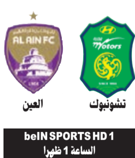
beIN SPORTS HD 1 الساعة 1 ظهراً