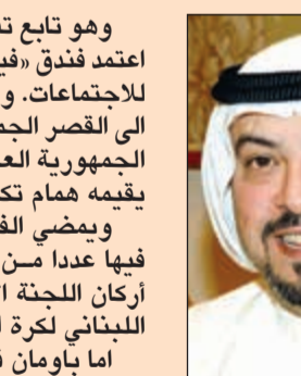
الشيخ د. طلال الفهد

وهو تابع تفاصيل تتعلق بالإقامة حيث اعتمد فندق «فينيسيا انتركونتيننتال» مقراً للاجتماعات. وفي الترتيبات الأخرى، زيارة الى القصر الجمهوري في بعيدا للقاء رئيس الجمهورية العماد ميشال عون، الى عشاء يقيمه همام توكريما للوفود. ويمضي الفهد اياماً في لبنان، يلتقي فيها عدداً من المسؤولين الرياضيين، من أركان اللجنة الأولمبية اللبنانية والاتحاد اللبناني لكرة القدم. أما باومان فحسب بزيارة لبنان محمداً لـ «الأنباء» موعد مغادرته في 25 الجاري، مؤكداً على الكفاءة الدولية للاتحاد الآسيوي لكرة السلة في ظل إدارة خاتشاريان ودعم الفهد بدوره، عرض خاتشاريان للمناسبة، مشيراً الى عرض رؤية الاتحاد الآسيوي لكرة السلة، واطلاع الحضور على مقره الجديد في ضاحية برج حمود شرق بيروت، ومناقشة أمور خاصة بلعبة كرة السلة.