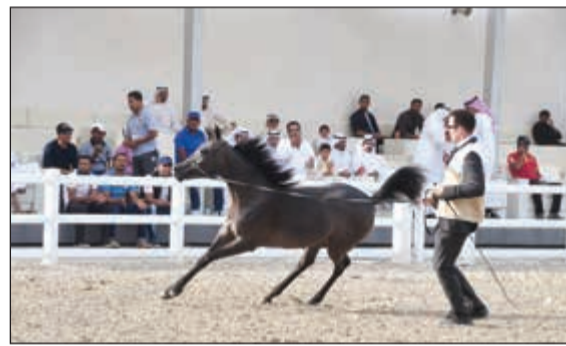
جانب من استعراض أحد الخيول المشاركة