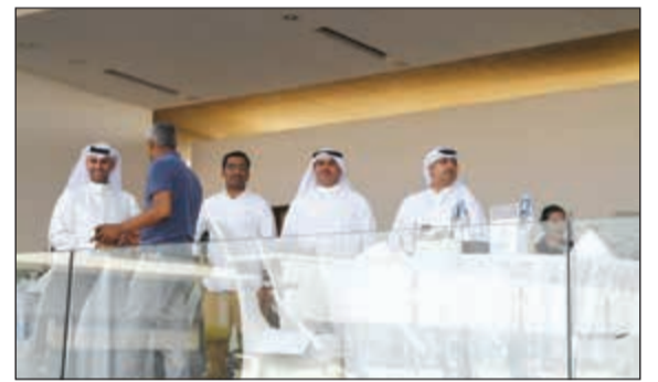
متابعة لمنافسات البطولة