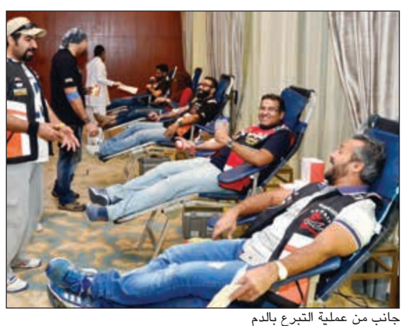
جانب من عملية التبرع بالدم

قام فندق جي دبليو ماريوت الكويت برعاية حملة للتبرع بالدم والتي نظمها فريق الفراعنة لقيادة الدراجات الآلية بالكويت (فيرو بايكرز) للسنة الرابعة على التوالي، وذلك بالتعاون مع بنك الدم المركزي بالكويت. وحضر الحملة أكثر من 200 من قائدي الدراجات الآلية من أغلب نوادي الدراجات بالكويت وقاموا بمشاركة الفريق في المسيرة التي جابت شوارع الكويت انتهاءً بالتبرع بالدم بقاعة الجواهر الفاخرة بفندق جي دبليو ماريوت الكويت، وحصدت الحملة ما يتعدى 70 كيس دم. وقد قام بنك الدم المركزي بتجهيز عبادة مصغرة تضم أجهزة متنوعة للتبرع بالدم،