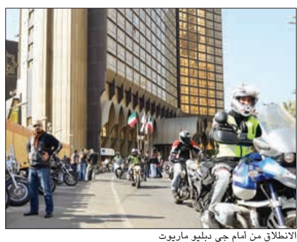
الانطلاق من أمام جي دبليو ماريوت