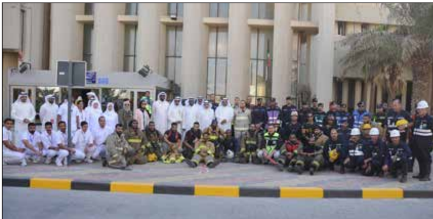
لقطة تذكارية للمشاركين في التمرين