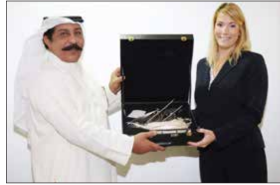
اللواء عبدالحميد العوزي يكرم إحدى المحاضرات

اختتمت الدورة التدريبية الخاصة بالتحقيقات في مجال الإنترنت لمكافحة المخدرات.