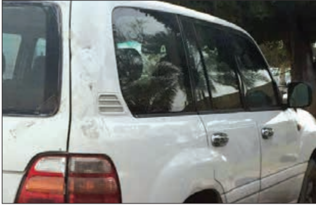
«الرباعية» التي ضبطت بسوق شرق

ضبطت إحدى دوريات الإسناد بالعاصمة مركبة مبلغا عن سرقتها بالواحة، وكانت إحدى الدوريات خلال تجولها في منطقة سوق السمك بسوق شرق قد اشتبهت في مركبة رباعية يابانية بيضاء اللون، وبالإستعلام عنها تبين أنها مطلوبة في سرقة قضية رقم (2013/33) مخفر الواحة وتمت احتالها إلى المخفر المختص.