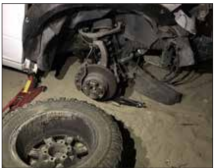
تلفيات في مركبة الأميركي

أصيب وافد من الجنسية الأميركية نتيجة اصطدام مركبة كان يستقلها بحصان على طريق اللياح، وكانت عمليات الداخلية قد تلقت بلاغا بوقوع اصطدام على طريق اللياح بين مركبة يستقلها 3 وافدين أميركيين وحصان، فانتقلت قوة أمنية وبرفقتها رجال الطوارئ الطبية والإسعاف إلى موقع البلاغ وتبين إصابة أحد الوافدين وتم إسعافه تمهيدا لإعداد تقرير بالواقعة وإحلالته للجهات المختصة.