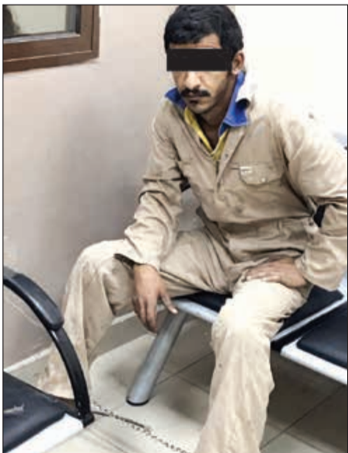
لص كراج حجز البلدية