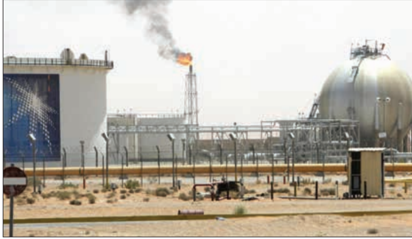
رؤية السعودية 2030 تهيئ المملكة لتنويع اقتصادها وعدم الاعتماد على النفط