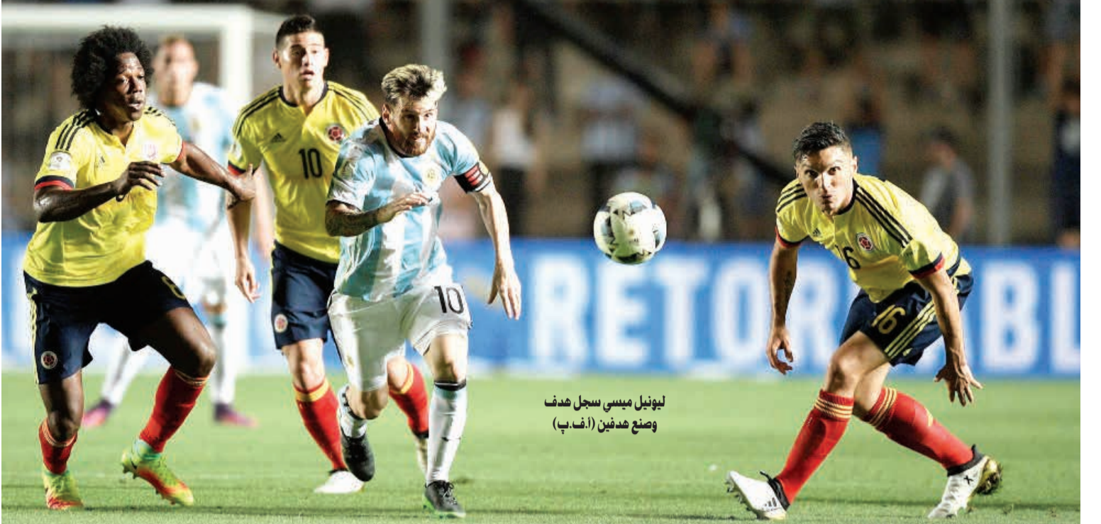
ليونيل ميسي سجل هدف وضع هدفين

مقبول على الإطلاق». الفوز السادس على التوالي للبرازيل وفي ليما، باتت البرازيل قاب قوسين أو أدنى من بلوغ النهائيات بفوزها خارج ملعبها على البيرو بهدفين نظيفين. والفوز هو السادس على التوالي للبرازيلي بإشراف مدربها الجديد تيتي الذي تسلم المهمة خلفاً لكارلوس دونغا في يوليو الماضي. وسجل المهاجم الشاب غابريال جيسوس المنتقل الهدف (57) ثم صنع الهدف الثاني ريناتو أغوستو في الدقيقة 78. وقاد مهاجم أرسنال الكسيس سانشينز منتخب بلاده تشيلي إلى فوز لاتف على الأوروغواي 3-1 بتسجيله هدفين. وجاء هدفا سانشينز في الدقيقة 60 و76 بعد ان ادرك اوارنو فارغاس التعادل 1-1 في نهاية الشوط الأول بعد ان تقدمت الأوروغواي بواسطة هدفها ادينسون كافاني في الدقيقة 16. وفي لاباز، فاز بوليفيا على