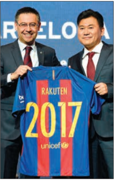
راكوتن اليابانية تخلف «القطرية» في رعاية البرسا