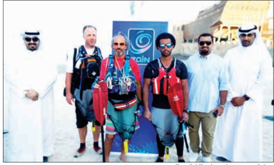
مسؤولو «زين» مع فريق Kuwait 4 Kayak

أعلنت زين الشركة الرائدة في تقديم خدمات الاتصالات المتنقلة في الكويت عن رعايتها لرحلة Kuwait 4 Kayak البحرية التوعوية، والتي تهدف إلى نشر الوعي الإيجابي بأهمية الحفاظ على البيئة البحرية في منطقة الخليج العربي، وذلك تحت رعاية الهيئة العامة للبيئة. وذكرت الشركة في بيان صحافي أن رعايتها لهذه الرحلة التوعوية جاءت في إطار استراتيجيتها تجاه قطاع البيئة، والتي ترتكز على سلسلة من المبادرات التي تخدم مجالات البيئة المختلفة وبالأخص البحرية منها باعتبارها قضية في غاية الأهمية في حياة الجميع، حيث أن رسالتها الاجتماعية تسعى إلى الحفاظ على الموارد الطبيعية وتعزيز الإدراك المجتمعي.