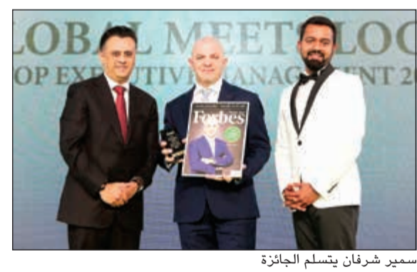
سفير شرفان يتسلم الجائزة

وحددت «نيسان» أولويات أعمالها في منطقة الخليج العربي خلال عام 2016، وهي تتضمن التركيز على النمو في السوق السعودية، والريادة في خدمة العملاء، والاستثمار المتواصل في بما يشمل أنشطة المسؤولية الاجتماعية، علاوة على ذلك، أسست «نيسان الشرق الأوسط» شركة متخصصة بالتوزيع في تركيا. وتم إطلاق دراسة «العالمية تلامي المحلية» على غرار قائمتها «فوربس العالمية» 2000، لأكبر الشركات المدرجة في العالم، وهي تسيطر الضوء على أهمية منطقة الشرق الأوسط والمسؤولين التنفيذيين العاملين فيها ضمن خارطة الأعمال العالمية.