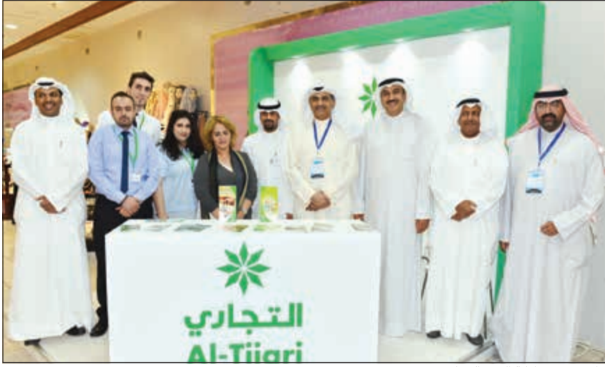
جانب من مشاركة البنك التجاري

برعاية محافظ الأحمدية الشيخ فواز الخالد، وبدعم مقدم من البنك التجاري الكويتي، نظمت محافظة الأحمدية الملتقى التوعوي الترفيهي الأول في مجمع كويت ماجيك وبمشاركة 15 من الجهات الرسمية والأهلية والمعنية بالصحة والسلامة والبيئة.