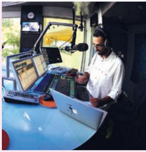
استديو مارينا أف أم