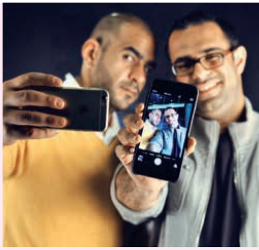
برنامج نغم الصباح