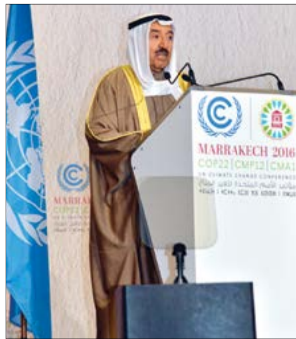
صاحب السمو الأمير الشيخ صباح الأحمد يلقي كلمته أمام القمة

مراكش (المغرب) - كونا: أكد صاحب السمو الأمير الشيخ صباح الأحمد التزام الكويت بمشاركة المجتمع الدولي في دعم الجهود التي تبذلها الأمم المتحدة لمكافحة ظاهرة تغير المناخ. كما أكد صاحب السمو الأمير في كلمة خلال الدورة الثانية والعشرين لمؤتمر الدول الأطراف في اتفاقية الأمم المتحدة الإطارية لتغير المناخ (كوب 22) بمراكش أمس الثلاثاء أن الكويت وضعت وبشكل طوعي الخطط المدروسة القائمة على أسس علمية واقتصادية وفق ما توافر لها من إمكانيات لإعادة تأهيل منشآتها النفطية وذلك التزاما منها بتعهداتها الدولية. وفيما يلي نص الكلمة: بسم الله الرحمن الرحيم الحمد لله رب العالمين والصلاة والسلام على نبينا محمد وعلى آله وصحبه أجمعين. جلالة الأخ الملك محمد السادس ملك المملكة المغربية الشقيقة أصحاب الجلالة والفخامة والسمو معالي الأمين العام للأمم المتحدة السيد بان كي مون أصحاب المعالي والسعادة