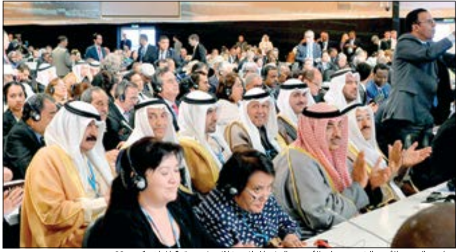
صاحب السمو الأمير الشيخ صباح الأحمد والوفد المرافق خلال مؤتمر قمة المناخ «كوب 22»