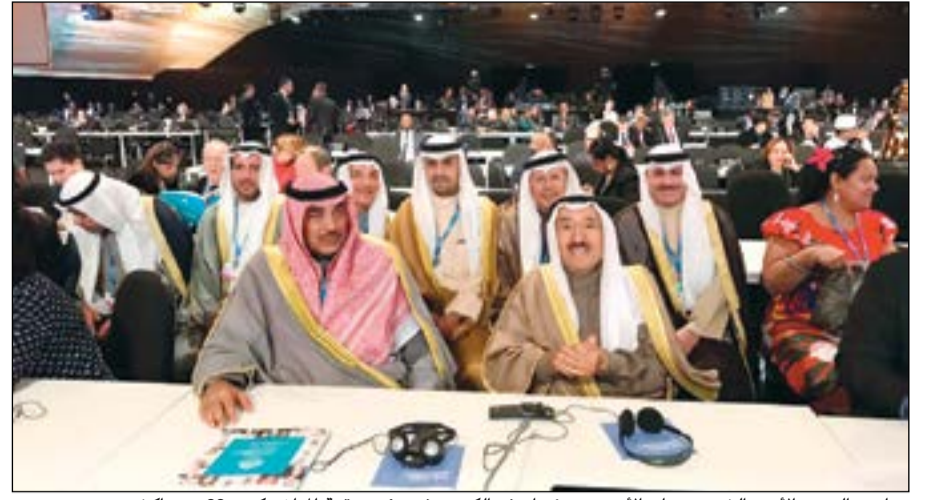
صاحب السمو الأمير الشيخ صباح الأحمد مترئسا وفد الكويت في مؤتمر قمة المناخ «كوب 22» بمراكش