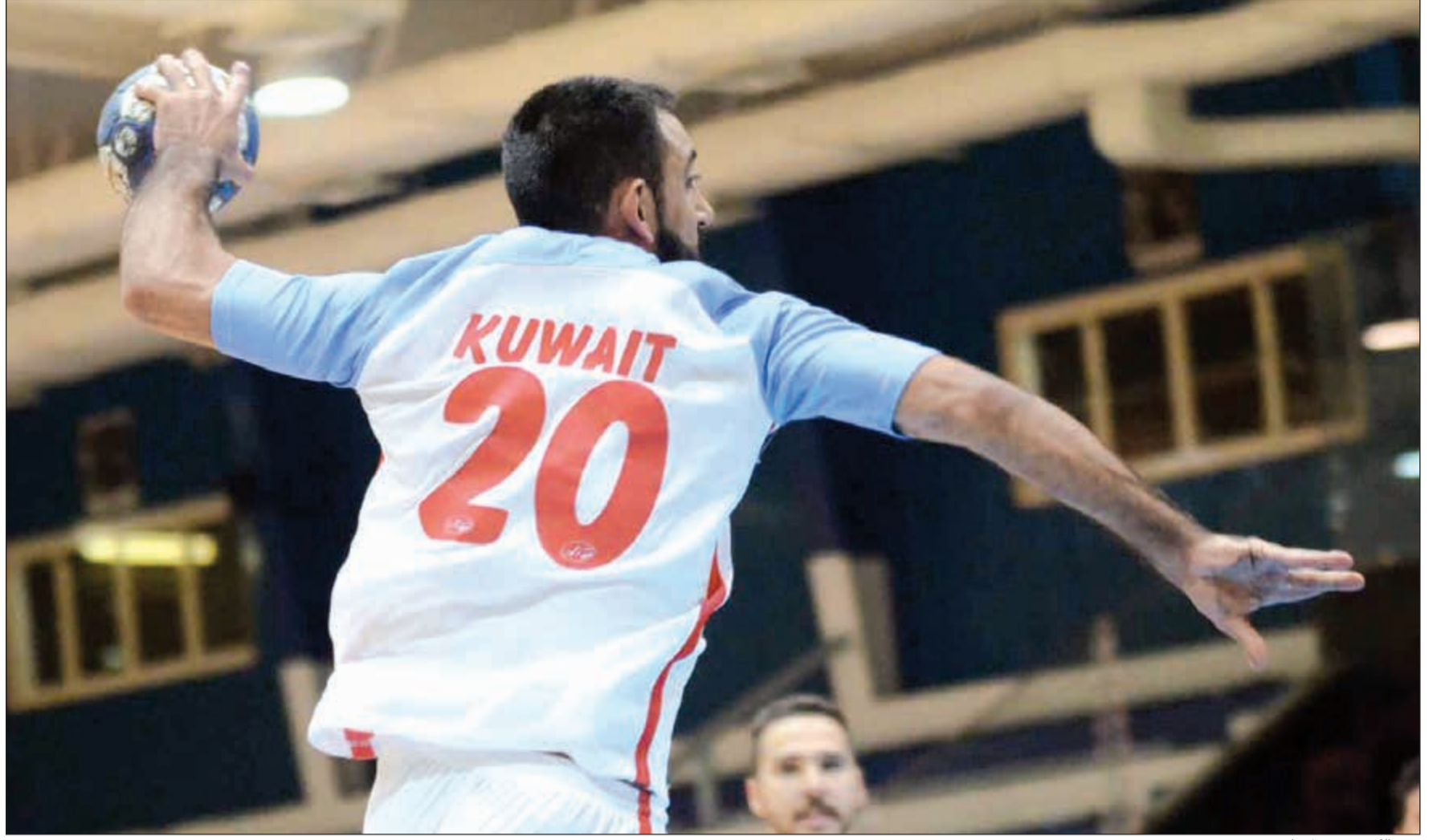
نجم الكويت مشعل طه

إبراهيم عادل العرجان @IALMUFJAN #اللاعب_الكويتي يطلع من دوامه ويروح مباراته على طول لو مكينة انفجرت ١٦ نوفمبر ٢٠١٦