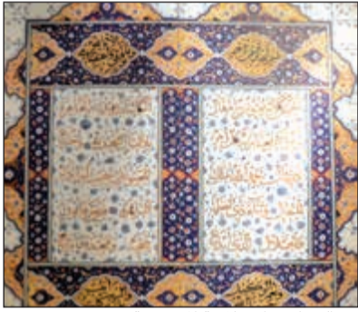
من الزخارف الإسلامية المعروضة