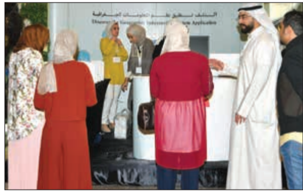
جانب من الحضور في المعرض للمصاحب