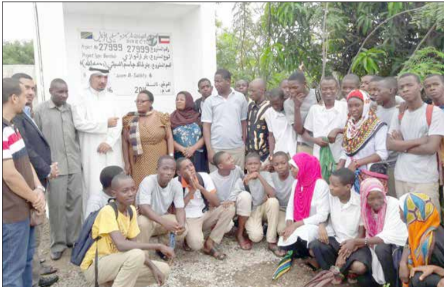
السفير جاسم الناجم خلال مراسم افتتاح البئر في إحدى المدارس الثانوية

في إحدى المدارس التي يبلغ عدد تلاميذها نحو 1000 طالب وجاء استجابة لنداء رئيس الجمهورية جون ماغوفولي بشأن الاهتمام بالتعليم وتوفير الخدمات الرئيسية للمدارس.