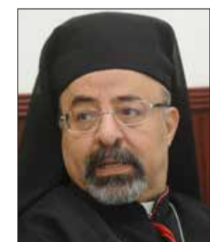
الأنبا إبراهيم إسحق

إلى الموروث الثقافي الكويتي الإيجابي عبر تاريخها، مبيناً أن الكويت كانت ولا تزال منارة ثقافية على المستويين الإقليمي والعالمي. وذكر أنه من المتابعين للحركة الثقافية والفكرية في الكويت من خلال منندياتها التي تقام طوال العام، مؤكداً حرصه على قراءة مجلة «العربي» بما تعقله من زخم ثقافي عربي كبير، وكذلك سلسلة «عالم المعرفة» التي تقدم أفضل الكتب والدراسات المترجمة.