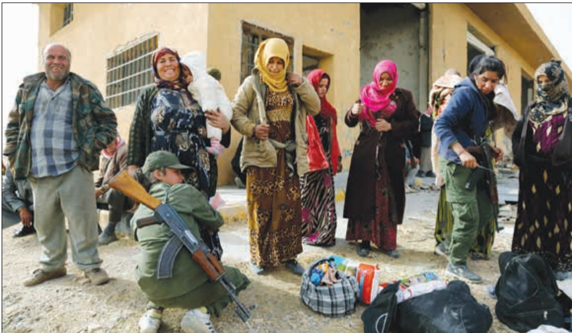
مقاتلان كرديتان تفتشان النساء الهاربات من المعارك قبل السماح لهن بدخول مخيم اللاجئين في عين عيسى

وقالت مصادر إعلامية مقربة من القوات الحكومية السورية لوكالة الأنباء الألمانية (د.ب.أ) إن الجيش سيطرته على خربة خان الشيخ، حيث أعلنت وكالة الأنباء السورية (سانا) أن وحدة من الجيش استعادت سيطرتها على خربة خان الشيخ، والملاحة الشرقية في ريف دمشق بعد اشتباكات مع المعارضة.