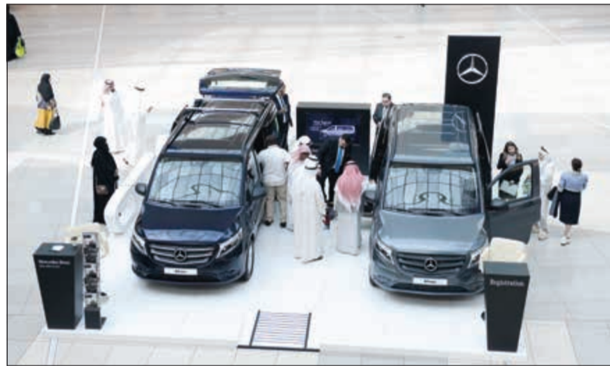
جانب من منصة العرض في الأفنيوز

وتعليقاً على الحدث قال مايكل رويله الرئيس التنفيذي لشركة البشر والكازمي: إن إطلاق فان مرسيدس بنز فيتو الجديد كلياً في السوق الكويتي يعد إضافة مهمة على طريق توفير مزيد من الاختيارات للعملاء المرتطمين باسم مرسيدس بنز والراغبين في التميز حيث تقدم هذه السيارات مزايا واسعة وأداء عالي المستوى في جانب راحة ورياحية غير مسبوقة إضافة إلى أنها تؤكد تميز مرسيدس بنز بقوة في فئة سيارات الميني فان