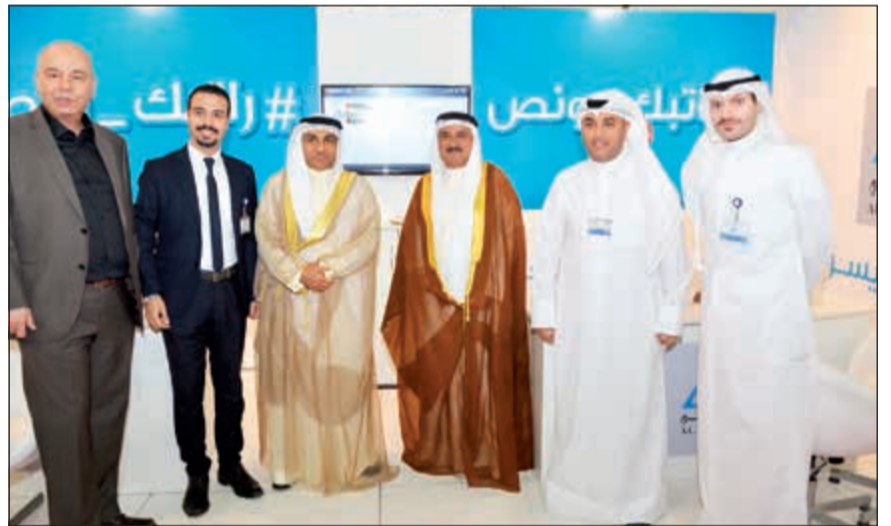
جناح «الدولي» في المعرض

ولفت جاليجان إلى الإقبال الكبير من زوار المعرض وعملاء البنك على جناح «الدولي» الخاص بالمعرض للتعرف على ما يقدمه من حلول مالية ومصرفية مبتكرة، بالإضافة إلى العروض التسويقية والحملات الترويجية المميزة. كما أثنى على جهود موظفي البنك الذين يقدمون أفضل ما لديهم من خلال شرح منتجات البنك للزوار ومنحهم الخدمات التمويلية التي تلبي احتياجاتهم وتواكب المدروسة.