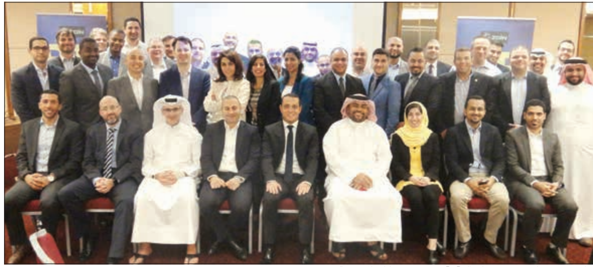
سكوت جيجنهايمر مع مسؤولي B2B من جميع شركات المجموعة

في فعاليات المنتدى: عندما يتعلق الأمر بالابتكار، فإن مجموعة زين تتولى طليعة المؤسسات في الأسواق التي تعمل فيها، وذلك من خلال تقديم تجربة عملاء ذات طراز عالمي وعن طريق عروض خدمات متكاملة ذات قيمة عالية.