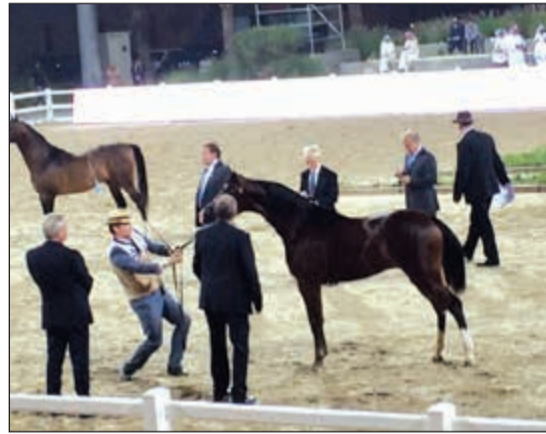
عروض مميزة لجمل الخيل في بيت العرب