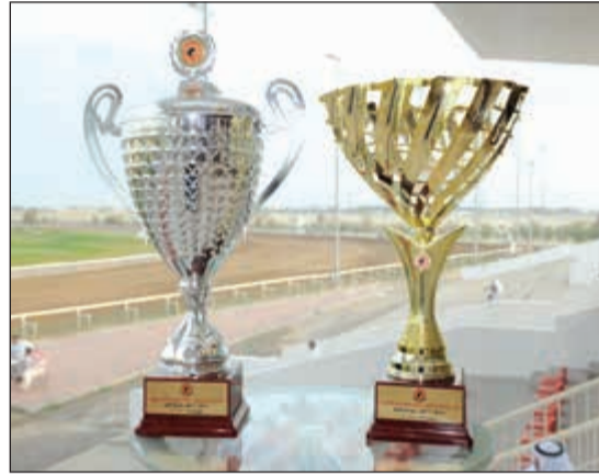
كأس المرحوم خالد يوسف المرزوق و«الأنباء» (هاني الشمري)

فهد للأبرق والميسترو للعصيمي وأوجب بطل كأس الافتتاح لنايف الرشيدى وعجاب لحامد المطيري». وأعرب الشيخ ضاري الفهد عن سعادهته للبداية الطيبة لسباقات نادي الصيد وبروز جيا جديدة في الافتتاح، وتوقع منافسات مثيرة خلال الموسم، وشكر الفهد أسرة جريدة «الأنباء» على دعمهم لسباقات النادي وتقديم الكاس السنوية لتخليد ذكرى المرحوم خالد يوسف المرزوق. وفي بقية الأشواط تتنافس خمسة جيا من الدرجة الثانية على مسافة 1400م وثمانية أفراس تتنافس على مسافة 1200م وخمسة جيا من المبتدئات تتنافس على مسافة 1200م أيضاً.