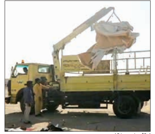
إزالة مخيم مخالف

أكدت وزيرة الشؤون الاجتماعية ووزيرة الدولة لشؤون التخطيط والتنمية هند الصبيح، أنه وبالتوافق مع أعضاء المجلس البلدي تم حل عدد من المعوقات التي وأكبت مشاريع خطة التنمية، وكذلك حلحلة كل المشاكل العالقة في بعض المشاريع، مشيرة إلى أنه تمت مناقشة 10 جهات حكومية لديها أكثر من 15 مشروعاً، أربعة منها انتهت معوقاتها ومازالت في الإجراءات النهائية لتصدير الموافقات، وهناك ثلاثة مشاريع تحت الدراسة، والمتبقي منها بحاجة لتضافر الجهود للانتهاء منها. وقالت الصبيح بعد ورشة العمل التي نظمتها لجنة الإصلاح والتطوير أمس حول مشاريع الدولة