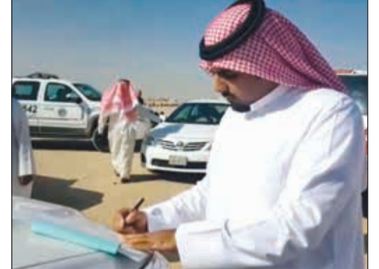
تحرير إحدى المخالفات

أكدت إدارة العلاقات في البلدية استمرار حملاتها الميدانية لإزالة المخيمات الريفية المخالفة في مختلف مناطق التخييم من خلال فرق الطوارئ في محافظات الجبراء والأحمدي في المواقع غير المسموح بالتخييم فيها في منطقة سكراب ميناء عبدالله. وقالت الإدارة في بيان صحفي أمس أن فريق الطوارئ التابع لبلدية محافظة الأحمدية أزال مخيمات ريفية في منطقة سكراب ميناء عبدالله بسبب مخالفتها للضوابط والاشتراطات التي حددتها البلدية وأسفرت عن إزالة 32 مخيماً مخالفاً. وأضاف البيان أن حملة الإزالة تأتي في سياق تنظيم عمل المخيمات الريفية للموسم 2016-2017 بهدف تحقيق مصلحة المواطنين والمقيمين من مرطادي البر والمصلحة العامة في الحفاظ على المكونات الطبيعية للبر وعدم الإضرار بها.