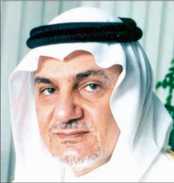
الأمير تركي الفيصل