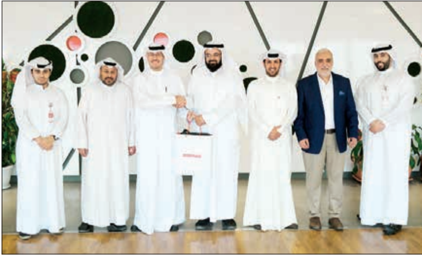
صورة جماعية لفريق Ooredoo وجمعية النوري الخيرية

قامت شركة Ooredoo بالتبرع بأجهزة كمبيوتر لاب توب لبعض الأسر المتعففة داخل الكويت لمساعدتهم في تطوير أداء العمل من خلال تزويدهم بالأجهزة بالتعاون مع جمعية عبدالله النوري الخيرية.