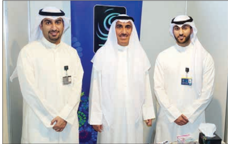
مدير جامعة الكويت دحسين الانصاري مع مسؤولي «زين» في المعرض

وأضاف الأيوب: تعتبر هذه المبادرة رغبة من موظفي الشركة لم يد العون والعطاء لكل محتاج وحرصا على مفهوم