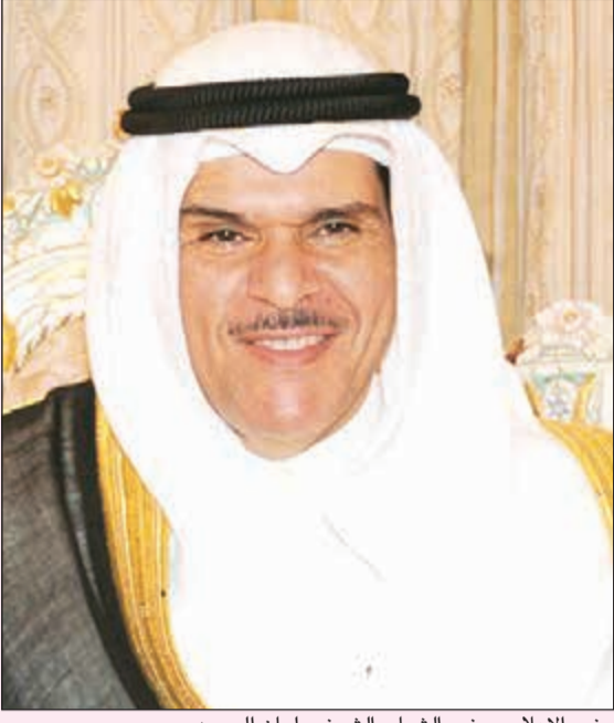
وزير الإعلام ووزير الشباب الشيخ سلمان الحمد