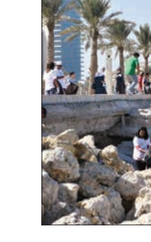
تنظيف شاطئ الشويخ