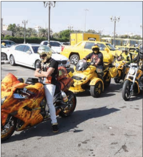
درجات نارية مشاركة

وتعويد النشء الجديد على نبذ العنف والفكر المنحرف. - ترسيخ القيم المجتمعية والراقية والمبادئ السلوكية والأخلاقية الحميدة، والحفاظ على الآداب العامة. وقال ان الإحصائيات تشير إلى أن عدد الحوادث المرورية خلال النصف الأول من العام الحالي بلغ 35695 حادثاً، أما عدد الوفيات فقد بلغ خلال التسعة أشهر الأولى 305 حالات وهو ما يكشف عن انخفاض بنسبة حوالي 3٪ مقارنة بأعداد الوفيات في التسعة أشهر الأولى من العام الماضي والتي بلغت 314 حالة، ويرجع ذلك الانخفاض إلى الدور الذي تقوم به المؤسسة الأمنية في مجال التوعية ممثلة بالإدارة العامة للعلاقات والإعلام الأمني والإدارة العامة للمرور وتفاعل المواطنين والمقيمين تفاعلاً إيجابياً معها.