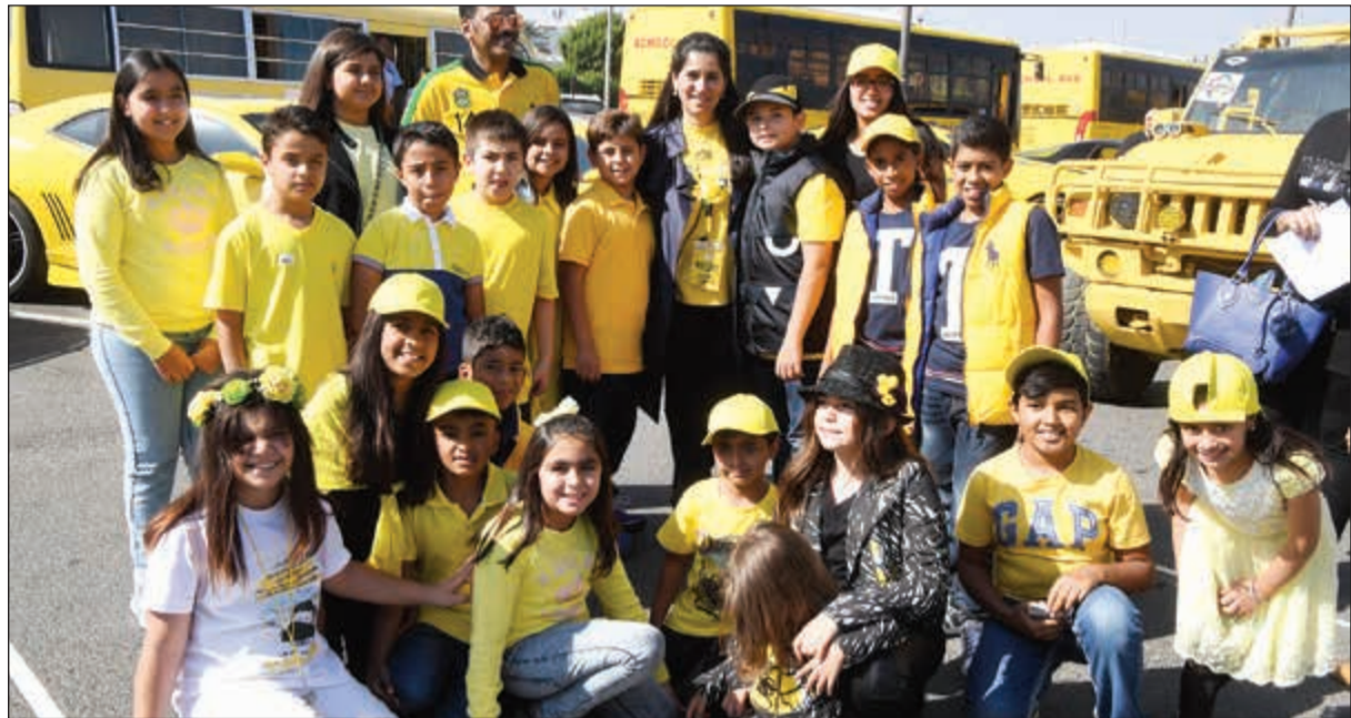
الشبيخة انتصار مع عدد من المشاركين في المسيرة

صغيرة لا داعي ولا مبرر لها. وأضاف ان اتباع هذا الأسلوب الإنساني المتحضر وأخلاقه نبيل يعلي القيم الراقية في مختلف جوانب التعامل بين أفراد المجتمع ويقلل الميل إلى العنف أو إثارة المشكلات بشأن أمور يمكن أن تحل ببساطة بكلمة طيبة أو بابتسامة خاصة أن جميع أجهزة الدولة مهتمة بإيجاد حلول جذرية لظاهرة العنف بين الشباب، سواء في