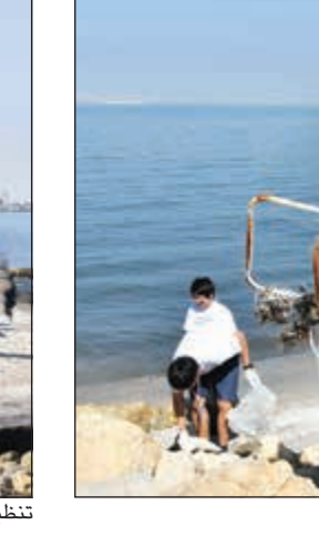
جانب من عملية تنظيف الشاطئ

أطلقت مبادرة النوير للإيجابية مسيرتها الصفراء للعام الثالث على التوالي بالتعاون مع وزارة الداخلية ووزارة التربية وجهات عديدة أخرى من شارع التعاون (شاطئ أنجفة) إلى شارع الخليج العربي (المارينا مول) بمشاركة 100 سيارة صفراء بالإضافة إلى سرب من الدراجات. وقالت رئيسة مبادرة النوير ورئيسة دار لولو للنشر الشبيخة انتصار السالم: «تمثل المسيرة الصفراء لنا هذا العام شكلاً جديداً من أشكال المسؤولية الاجتماعية تجاه المجتمع عن طريق الترويج لنشر رسائل اللطف بين أفراد المجتمع الواحد والبيئة المحيطة بهم لكي يصبح اللطف جزءاً لا يتجزأ منا، وذلك بعد النجاح الكبير الذي أثمرته المسيرتان السابقتان في القيادة بلطف على الطرقات». وأضافت السالم «انطلقت المسيرة الغالطة بقيادة سيارة النوير الصفراء، وتعد هذه المسيرة الأولى من نوعها في الخليج العربي تزامناً مع يوم اللطف العالمي الموافق يوم 13 نوفمبر من كل عام والذي تم الإعلان عنه لأول مرة في العام 1998 من قبل حركة اللطف العالمية.