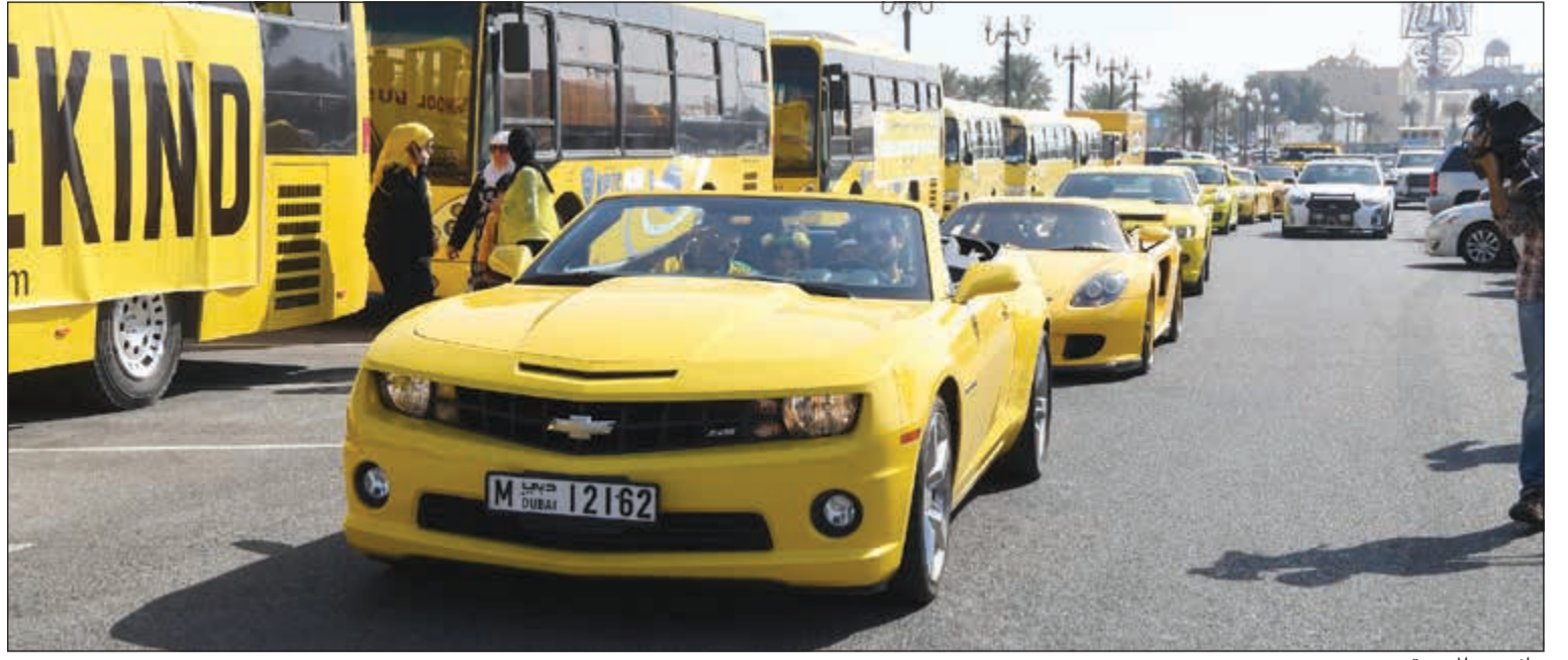
جانب من المسيرة

من «شاطئ أنجفة» إلى «المارينا مول» وإطلاق أول كرنفال من نوعه