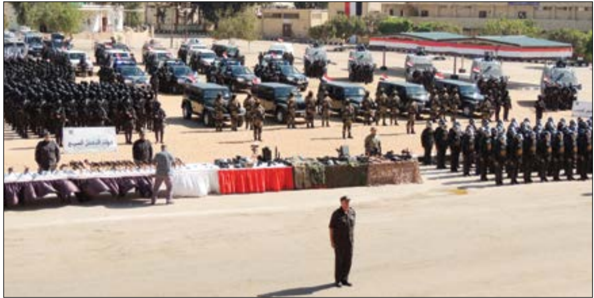
هكذا استعدت قوات الامن المركزي لما اطلق عليه «ثورة الغلاة» في 11/11

فتحت البنوك المصرية أبوابها أمس لاستقبال العملاء لتغيير العملات وصرف الحوالات المصرفية على الرغم من دعاوى التظاهر والشغب. وواصل الدولار تراجعها أمام الجنيه حيث بلغ سعر البيع للدولار في البنك الأهلي 16,45 جنيهاً و16,15 جنيهاً للشراء بينما سجل الدولار في بنك القاهرة 16,45 للبيع و15,95 للشراء كما واصلت البنوك العاملة بمطار القاهرة الدولي، استقبال عملائها أمس. الي ذلك، بلغ سعر صرف الدينار الكويتي 53,20 جنيهاً للشراء، و54,35 جنيهاً للبيع، وعلى مستوى التحويلات، بلغ تحويل الدينار أمام الجنيه نحو 53,21 جنيهاً للشراء و54,34 جنيهاً للبيع.