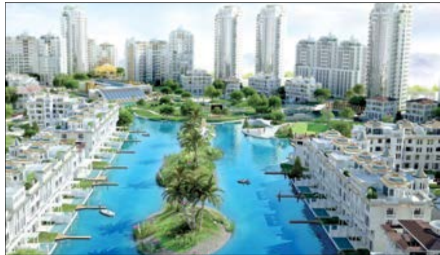
تركيا الرجة الأكثر استقطابا للمستثمرين

مختلفة في مدينة صباح الأحمد البحرية وبوئائق حرة، حيث تعتبر مدينة صباح الأحمد البحرية من اصخم وأرقى المشاريع التي نفذت من قبل القطاع الخاص في الكويت، كما تمتاز مدينة صباح الأحمد البحرية باطلاليتها البحرية الساحرة، بالإضافة الى الخدمات والمشاريع التجارية. «تائق العقارية» من جهتها أعلنت شركة تائق المستقبل العقارية عن بيع المرحلتين الأولى والثانية لبرج آفاق في منطقة الجفير في مملكة البحرين الذي يعد ثالث مشروع للشركة وهو مختلف كلياً عن مشاريعنا السابقة حيث يتكون من 23 طابقاً، الطوابق الستة الأولى تشمل صالة الاستقبال ومواقف السيارات وناديا صحيا متكاملًا ومساح، ويمتاز أيضا بشكله البناونامي، كما أن هذا المشروع مختلف كلياً من حيث مساحات الشقق بالنسبة للمشروعين الآخرين ويعد من المباني الذكية ولأنه يحتوي على مجموعات عديدة للخدمات المتكاملة التي توفر شعور الرضا والأمان للملاك. «بافاريا العقارية» من جانبها طرحت شركة بافاريا العقارية مشاريع متعددة