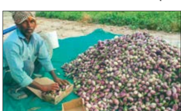
البانديجان الصغير في مزرعة الصفران