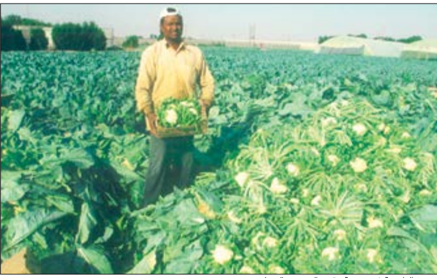
الزمرة الناصعة في مزرعة مقيت العجمي بالعبدلي

وختم المزارع المطيري بالتركيز على أهمية المتابعة شبه اليومية لما يجري في المزرعة من قبل حائزها وتشجيع عمالها وإكرامهم بالسكن المناسب والراتب المصروف في وقته ومعاملتهم معاملة طيبة، والأهم شراء أفضل المستلزمات الزراعية من شركات زراعية مشهود لها بالأمانة والكفاءة، مشيرا إلى أن الاستعدادات قائمة على قدم وساق في مزرعته الجديدة الأخرى في القطعة 11 من الوفرة، كي يزرع نحو 32 طنا من تقاوي البطاطا الفرنسية المستوردة خلال الأيام القليلة المقبلة.