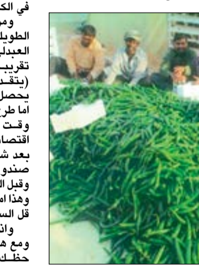
الفلفل الحار في مزرعة سلطان الزراعة