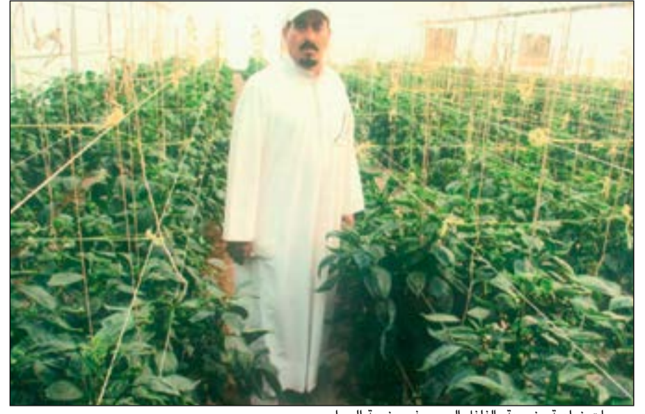
مجمعات زراعية مزروعة بالفلفل الرومي في مزرعة الحواس