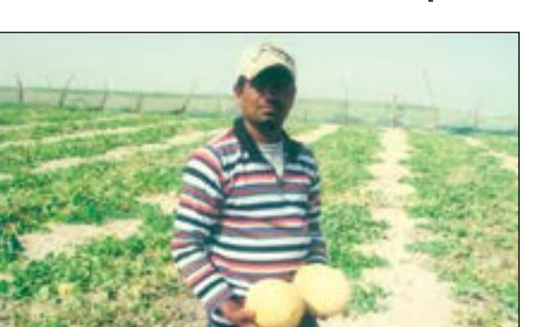
البيطخ الأصفر اللذيذ في حقول آل المدعج في العبدلي