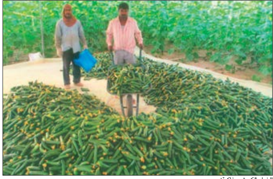
الخيار الكويتي.. فاكهة!

صفحة أسبوعية متخصصة في الثروة الزراعية بمختلف قطاعاتها: نبات - حيوان - طير - سمك متضمنة إجازات المزارعين وقضاياهم في المناطق الزراعية ولاسيما في العبدلي والوفرة والصببية وكبد للتواصل معنا: Email:Editorial@alanba.com.kw