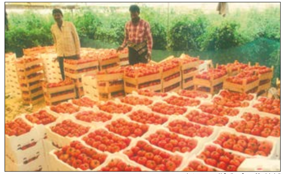
الطماطم الكويتية صالحة للتصدير.. شتاء