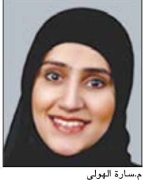
م. مسارة الهولي