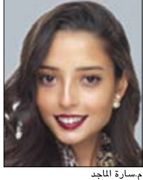
م. مسارة الماجد