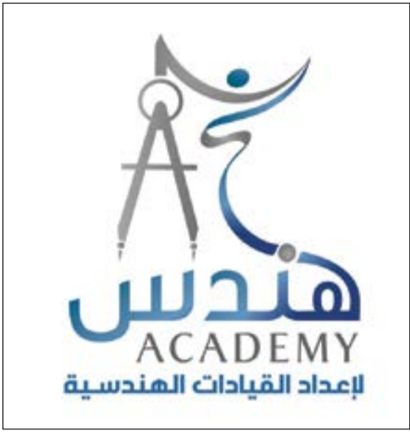
شعار أكاديمية هندس