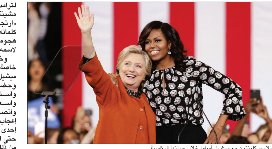
هيلاري كلينتون مع ميشيل أوباما خلال حملتها الرئاسية

بييل كلينتون. وتركت السيدة الأولى بصماتها المؤثرة في الكلمة التي ألقتها خلال مؤتمر الحزب الديموقراطي الذي اختار كلينتون مرشحة للرئاسة، وعالجت قضية العنصرية التي كانت تعصف بالبلاد جراء تصريحات ترمب ضد المسلمين والأفارقة ونذوي