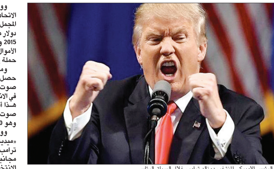
الرئيس الأمريكي المنتخب دونالد ترامب خلال السباق الرئاسي

ميراث يتقصر عليها كثير من المرشحين السياسيين. وقال توني كوراو، وهو أستاذ في كلية كولي في ولاية مين: «اعتقد أن هذه حالة اتسم فيها بخصائص فريدة كمرشح اتاحت له أن ينتهج استراتيجية مختلفة».