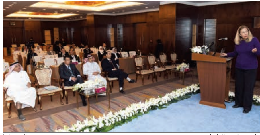
جانب من إحدى الجلسات

واصل المؤتمر الرابع للمعهد الأميركي للخرسانة - فرع الكويت أعماله أمس بتنظيم من شركة «نوف إكسبو»، حيث يختتم اليوم أنشطته بحضور قيادات شركات صناعة البناء والتشييد في المنطقة حيث أظهر أن المشاريع العملاقة تعظم صناعة الخرسانة الكويتية لكن في نفس الوقت هناك تحديات عدة لهذه الصناعة.