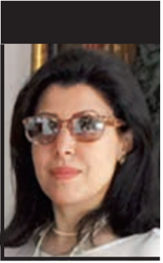
الشيخة حصة الحمود السالم الحمود الصباح