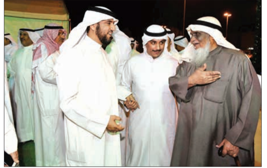
ترحيب بابناء الدائرة الرابعة