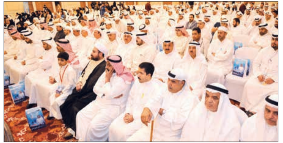
جانب من الحضور خلال الندوة

يجب استيراد العلاج عبر إنشاء مصحات مجهزة عالمياً وبالتالي ينتفع منها المحتاج والمستحق وتمنع السياحة الكاذبة عبر العلاج في الخارج. وحول تلوث البيئة قال لا أحد يعالج بشكل حقيقي أجواءنا وأرضنا وسماواتنا وبحرنا، مؤكداً أن موجة الفساد عالية جداً لكن همة المواطن الكويتي أكبر وأعلى منها وسوف يختار الإصلاح والأفضل والأكثر كفاءة وأفضلها ظاهرة النائب الهارب الذي لا يراه الناخبون فور وصوله للبرلمان، مشدداً على متابعة حلول العلاج والنهوض بالبلد من جديد ولا نتركها للمفسدين.