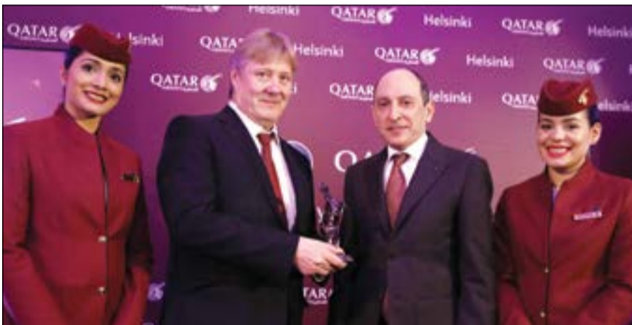
أكبر الباكر يتبادل وكاري سافولاين الهدايا التذكارية

وخلال مؤتمر صحفي عقد في العاصمة هلسنكي، عبر أكبر الباكر الرئيس التنفيذي لمجموعة الخطوط الجوية القطرية عن فخره بتدشين الرحلات الجديدة للخطوط الجوية القطرية إلى هلسنكي، وقال: تكمل هذه الوجهة الجديدة استراتيجيتنا في تلبية حاجات عواصم الشمال الأوروبي، وتسهيل السفر لإنجاز الأعمال وتعزيز