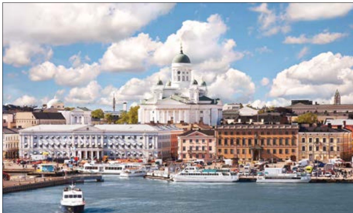
هلسنكي وجهة جديدة تضاف إلى وجهات الخطوط القطرية