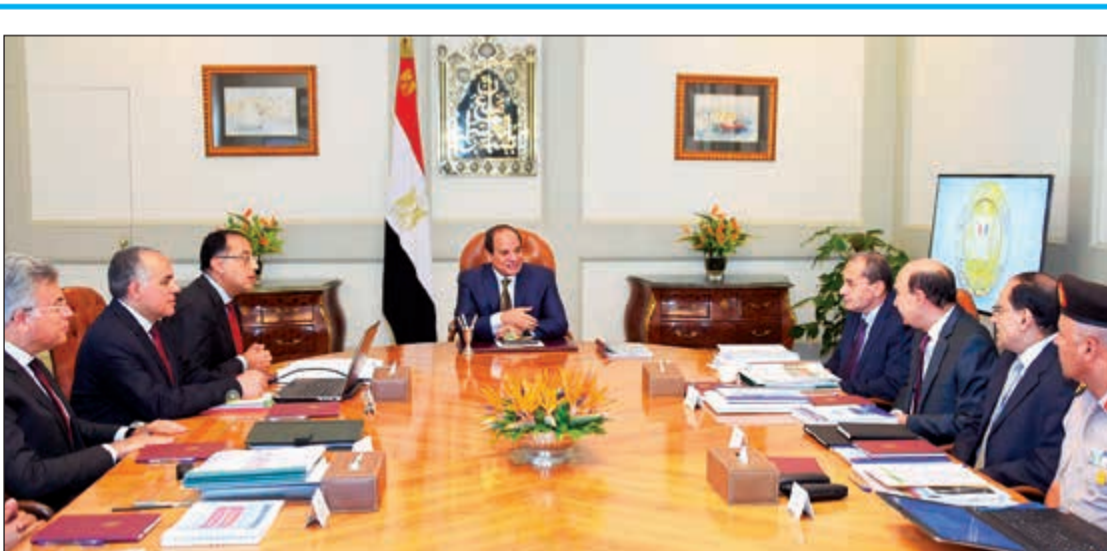
الرئيس عبدالفتاح السيسي خلال اجتماعه بمجموعة من الوزراء والقائدات لمتابعة تنفيذ العديد من المشاريع الجديدة