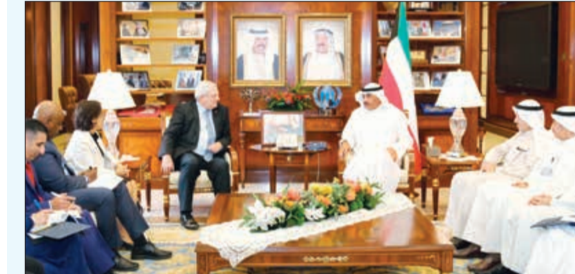
الشيخ صباح الخالد خلال لقائه مع ستيفن أوبراين بحضور الشيخ د.أحمد ناصر المحمد وصالح اللوغاني وناصر الصباح

أشاد مساعد الأمين العام للأمم المتحدة للشؤون الإنسانية ومنسق شؤون الإغاثة في حالات الطوارئ ستيفن أوبراين بجهود الكويت الحثيئة لدعم الأعمال الإنسانية. جاء ذلك خلال استقبال النائب الأول لرئيس مجلس الوزراء ووزير الخارجية الشيخ صباح الخالد بمكتبه بوزارة الخارجية مساعد الأمين العام للأمم المتحدة للشؤون الإنسانية ومنسق شؤون الإغاثة في حالات الطوارئ بمناسبة زيارته للبلاد.