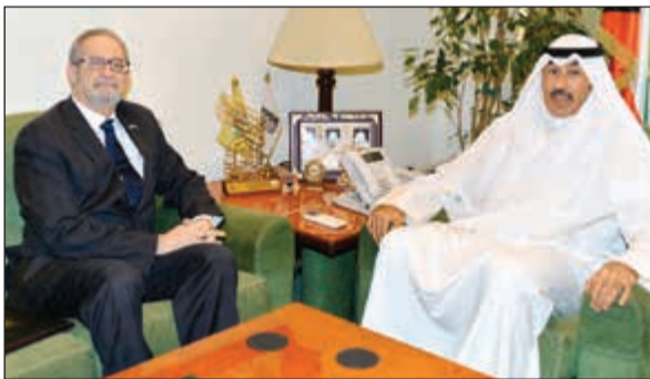
الشيخ فواز الخالد مستقبلاً السفير لورانس سيلفرمان

استقبال الخالد، معرباً عن التقدير البالغ للرعاية التي تحظى بها البعثة الدبلوماسية لبلاده والجالية الأميركية على الصعيدين الرسمي والشعبي في الكويت.