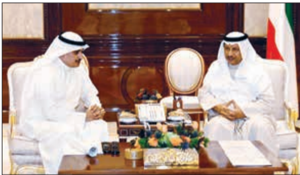
سمو الشيخ جابر المبارك مستقبلاً م. أحمد المنفوشي

في الدولة حتى عام 2040 والذي يتسم بالمرونة والقدرة على استيعاب أي تعديلات او متغيرات أو تطورات في السياسات العامة للدولة بالتنسيق مع جميع الجهات الحكومية وغير الحكومية.