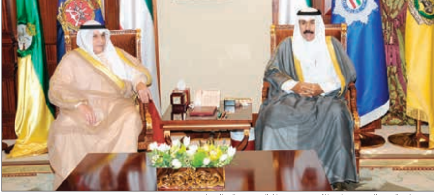
سمو ولي العهد الشيخ نواف الأحمد مستقبلاً الشيخ خالد الجراح

كما استقبل سموه نائب رئيس مجلس الوزراء ووزير الدفاع الشيخ خالد الجراح. كما استقبل سمو ولي العهد الشيخ نواف الأحمد بقصر بيان أمس وزير الإعلام ووزير الدولة لشؤون الشباب الشيخ سلمان الحمود ووزير الدولة لشؤون مجلس الوزراء الشيخ محمد العبدالله.