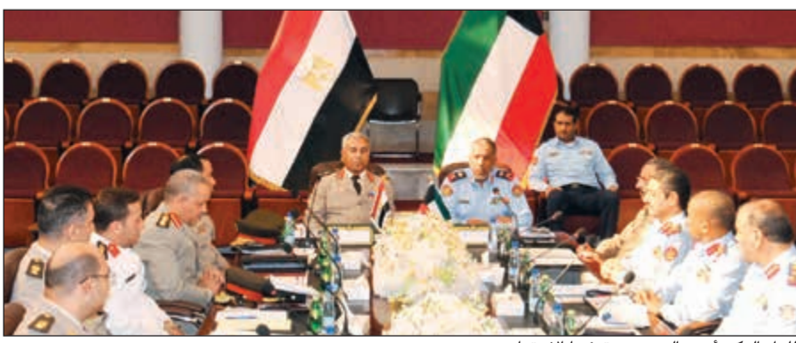
اللواء الركن أحمد العميري مترشفاً الاجتماع

عقدت صباح أمس الجلسة الافتتاحية للاجتماع العاشر للجنة الكويتية - المصرية المشتركة برئاسة معاون رئيس الأركان لهيئة العمليات والخطة اللواء الركن أحمد العميري ومساعد وزير الدفاع المصري اللواء أركان حرب أحمد إبراهيم أحمد. وافتتح الاجتماع رئيس الجلسة اللواء الركن أحمد العميري بكلمة رحب من خلالها بالوفد