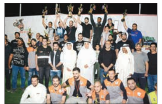
تتويج الفائزين في ختام البطولة

شهدت منافسات بطولة «تايم أتك» للسيارات التي اختتمت أمس مشاركة كبيرة من نخبة المتسابقين في البلاد وجاءت حافلة بالنتيجة والقوة والإثارة في منافساتها.