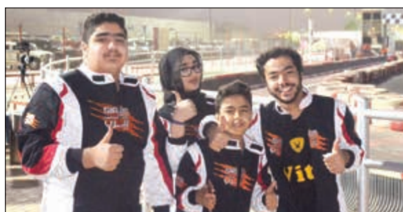
عدد من المشاركين والمشاركات في الكارتينج

البعيد عن تلك المعوقات التي تحول دون بناء جيل واع وواع لرياضة السيارات، ولهذا التجمع أسباب كثيرة ومتنوعة، ولعل من أهمها أن بإمكانك أن تتلمس الجو التنافسي وفق معايير وشروط خاضعة لقاعدة الأمن والسلامة وهذا المناخ يبرز لك منذ اللحظة الأولى لدخولك الى الحلبة، كما أنك تجد أيضاً ذلك المناخ العائلي الذي يوزن الجو التنافسي الذي يتوزع على كافة المشاركين بمن فيهم المنظمين.