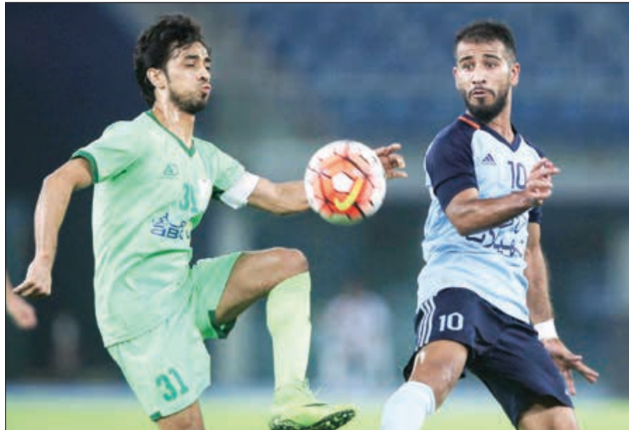
مواجهة تارية منتظرة بين السالمية والعربي (الأزرق.كوم)