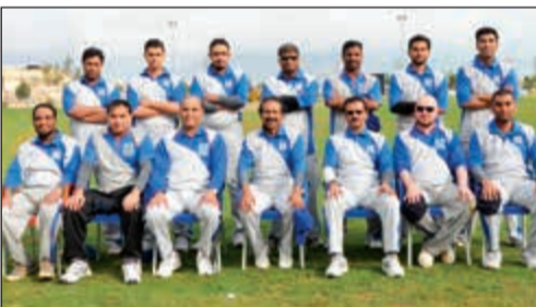
فريق بنك الكويت الدولي قدم مستوى كبيراً في المباراة

أعلن بنك الكويت الدولي فوز فريقه للكريكت على نظيره بنك الخليج محققاً 5 ويكيت بكل جدارة، وذلك في مباراته الأولى ضمن دوري نادي مصارف الكويت الذي يقام حالياً على ملاعب الكريكت في الصليبية. وبعد أن بدأ بنك الخليج المباراة لفوزه بالقرعة، أظهر رماة الدولي منذ البداية حرفة في اللعب عن طريق الضغط على لاعبي الفريق المقابل بشكل مستمر، مسجلين الويكيت تلو الآخر، بينما اقتصر تسديد بنك الخليج على 117 نقطة فقط.