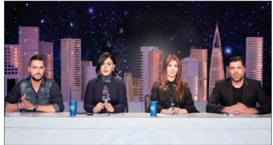
لجنة تحكيم «آراب أيدول»

على أن تعطيه «نعم» بعد أن طلبت الرحمة والمغفرة للفتاة الراحلة ذكرى.