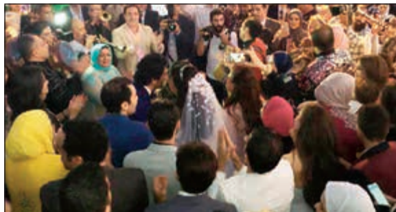
حضور فني كبير في حفل الزفاف بالجنوة

ونكرت وسائل اعلام مختلفة ان السبكي كان يقوم بدور والدا العروسين، حيث حاول إضفاء السرية على الحدث ومنع تسريب أي