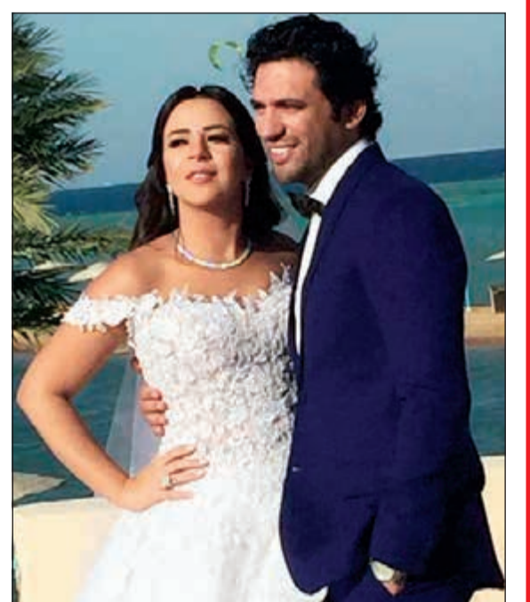
العروسان حسن الرداد وإيمي سمير غانم

في الوقت الذي توقع فيه البعض أن زفاف حسن الرداد وإيمي سمير غانم سيكون خالياً من الفنانين وأن عدداً محدوداً هو من سيحضر الزفاف، خاصة بعد أن تمت دعوة الجميع من خلال «الواتساب»، سربت لقطات كثيرة لتصوير حفل الزفاف، وأظهرت انه كان بمنزلة مهرجان فني حضره عدد كبير جداً من النجوم، ومنهم درة التي عادت من تونس من مهرجان قرطاج لتحتفل بزفاف الرداد وإيمي وعائلة أحمد السبكي بالكامل والفنانين عمرو يوسف وماجد المصري وزوجته وأحمد زاهر ومها أحمد وروجينا وزينة