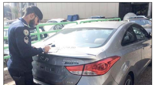
أحد رجال المرور أثناء تسجيل مخالفة

استكمالا وإيضاحا للبيان الذي أصدرته الإدارة العامة للعلاقات والإعلام الأمني بوزارة الداخلية بشأن استمرار العمل بالمادة 42 من قانون المرور الخاص بسحب لوحات المركبات العرقله لحركة السير دون استثناء أو انتقائية بالتطبيق، أوضحت الإدارة أن وكيل وزارة الداخلية الفريق سليمان الفهد، أصدر تعليماته لرجال المرور بمراعاة التعامل مع بعض الفئات والمواقع انطلاقاً من اعتبارات إنسانية أو عملية وهي: طلبة الجامعة والتعليم التطبيقي، المستشفيات الحكومية والخاصة، المواقع التي يرتادها كبار السن وذوو الاحتياجات الخاصة، عمليات تفريغ البضائع أو تحميلها عند بعض المجمعات التجارية، واستطردت الإدارة أن الفريق الفهد أكد على ضرورة التمييز في هذه الحالات بين التعامل مع مخالفة ممنوع الوقوف، ومخالفة عرقله السير، ومراعاة ظروف كل المواقع والفئات طبقاً للنواحي الإنسانية والواقعية والعملية. وأكدت الإدارة أنه منذ تفصيل المادة 42 من قانون المرور تضع الإدارة العامة للمرور في اعتبارها تعليمات الفريق الفهد واضحة ويتم العمل بها من جانب