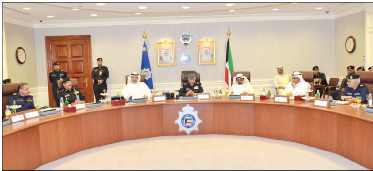
الدوسري يترأس اجتماع غرفة اتخاذ القرار

الخالد ووكيل وزارة الداخلية الفريق سليمان الفهد على الأداء الأمني عالي المستوى الذي اتسمت به المرحلة الماضية والجهود المكثفة التي بذلتها الأجهزة الأمنية على اختلاف واجباتها في حفظ الأمن والاستقرار. كما تم خلال الاجتماع مناقشة عدد من الموضوعات وبحث وتدارس الأفكار ومعالجة السلبيات التي رصدت في الانتخابات السابقة وطرح حلول ومعالجات لتلافيها وكذلك دور كل وحدة أمنية في تأمين العملية الانتخابية والمهام والمسؤوليات المنوطة به بما يظهر الصورة الديمقراطية