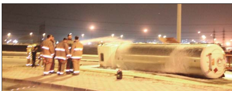
الصهريج بعد رفعه من الطريق

قائد الصهريج بإصابات متفرقة ونقل على إثرها إلى المستشفى عن طريق الطوارئ الطبية. وقامت فرق الإطفاء بتأمين الموقع والتعامل مع الحادث، حيث أزيلت الصهريج المقلوب من