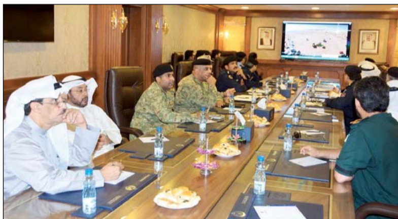
الاجتماع التنسيق بين ممثلي الجهات المعنية بالسيول والأمطار

المناطة بكل جهة للإعداد المسبق والتأهب للكوارث والسيول المتوقع حدوثها في مناطق معينة ورفع مستوى التنسيق بإزالة أي مخاطر قد يتعرض لها المواطنون والمقيمون.