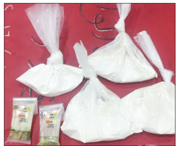
كمية الهيروين المضبوطة بالنويصيب

ألقى مفتشو نوبة «ب» بقيادة رئيس التفتيش سعد القريني في جمارك النويصيب القبض على ثلاثة مسافرين بعد أن عثر بحوزتهم على مواد مخدرة، وكان المسافرين قد تقدموا لإنهاء إجراءات وصولهم إلى البلاد لكن أحد المفتشين لاحظ الارتباك في تصرفاتهم واصطحبهم للتفتيش والفحص وعثر بحوزتهم على 160 غرام هيروين.