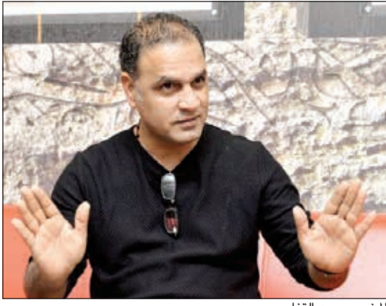
المخرج محمد القفاص