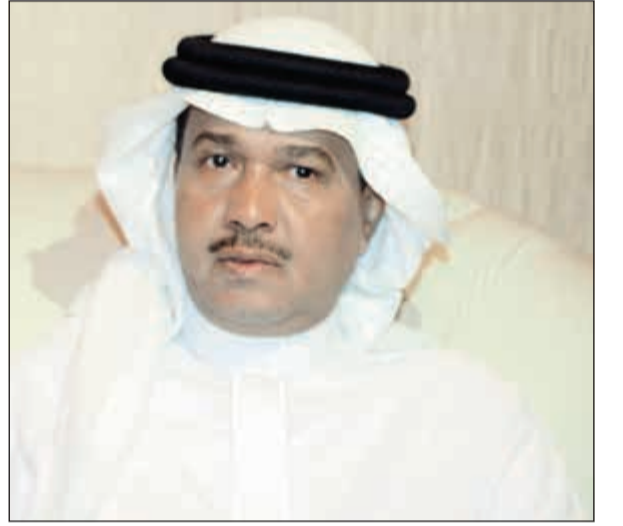
«فنان العرب» محمد عبده

أكد «فنان العرب» محمد عبده أن الفنان المحب لفنّه لا يستطيع أن يتوقف عن الغناء أو الفن الذي يمارسه، وقال: إذا