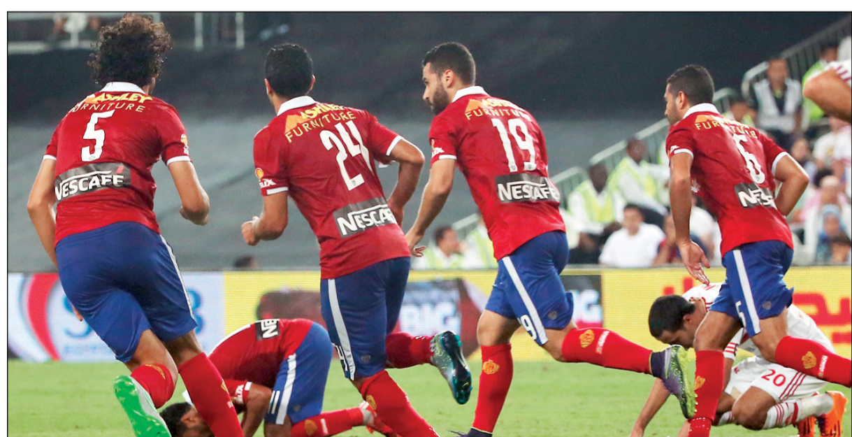
لاعبو الأهلي يسعون لتحقيق الفوز على طنطا اليوم