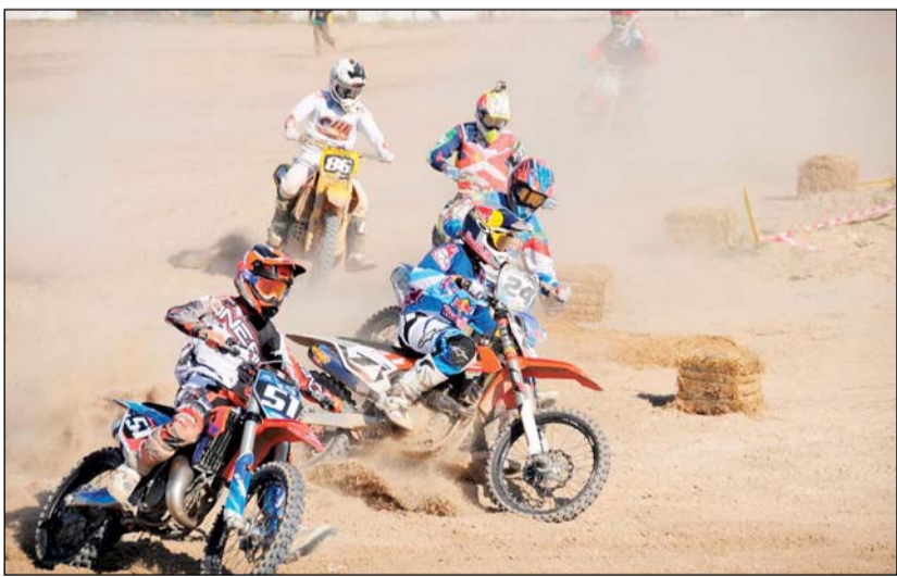
البطولة على موعد مع التحدي والإثارة بين الشباب الكويتي

أهداف النادي لجذب أبناء الكويت تحت مظلة لممارسة هواياتهم بطريقة آمنة وتحت إشراف متخصصين مؤهلين من ذوي الخبرة في تنظيم سباقات السيارات والدراجات، علماً بأن البطولة ستشهد مشاركة كبيرة من أبرز نجوم متسابق الموتوكروس في الكويت. وأعرب الداود رئيس اللجنة العليا المنظمة للبطولة عن بالغ شكره وتقديره لوزير الدولة لشؤون الشباب ووزير الإعلام على دعمه اللامحدود، مشيداً بالتعاون الذي يقدمه لإنجاح أنشطة النادي المختلفة. وأضاف أن النادي حرص على التعاون مع الجهات الحكومية لضمان إنجاز البطولات وعمالاً بمتطلبات وشروط تحقيق لطموحات الشباب الكويتي المحب لهذه الرياضة المشوقة التي تلقى أقبالاً كبيراً من جميع فئاتهم العمرية. وقال الشيخ أحمد الداود رئيس النادي إن تضامر الجهود يمثل الأساس القوي لنجاح