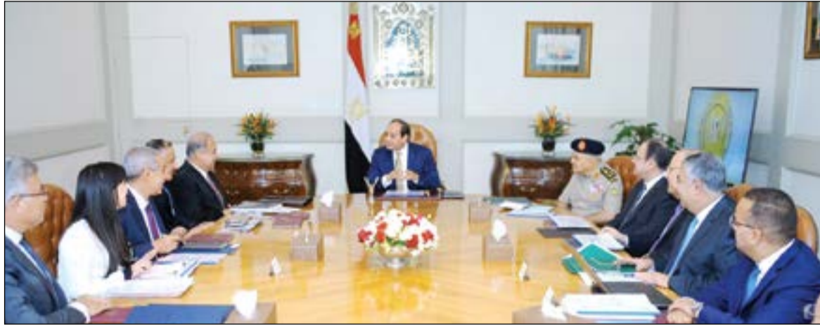
الرئيس عبدالفتاح السيسي يترأس الاجتماع الأول للمجلس الأعلى للاستثمار بحضور كامل أعضائه

أصدر المجلس الأعلى للاستثمار في اجتماعه الأول برئاسة الرئيس عبدالفتاح السيسي، وبحضور كامل أعضائه، مجموعة من القرارات المهمة في ضوء المناقشات التي دارت خلال الاجتماع والتي جاءت في 17 نقطة هي: