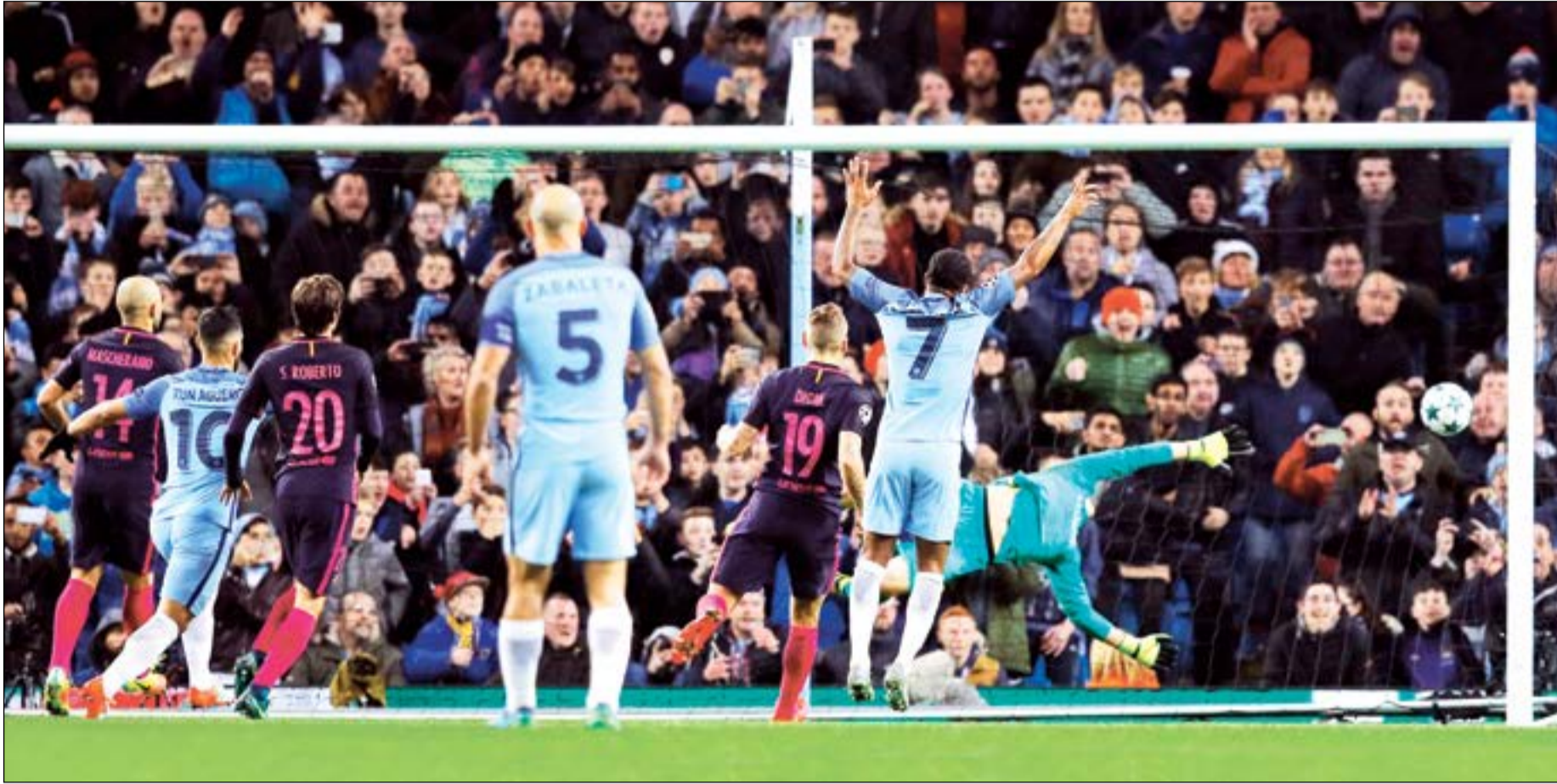
صادها دي بروين

ثار مان سيتي الإنجليزي من برشلونة الإسباني وهزمه 3-1 في الجولة الرابعة من دور المجموعات في دوري أبطال أوروبا لكرة القدم الذي شهد أيضا تاهل أربعة اندية إلى دور الـ16، هي أرسنال الإنجليزي وباريس سان جيرمان الفرنسي وبايرن ميونيخ الألماني وأتلتيكو مدريد الإسباني.