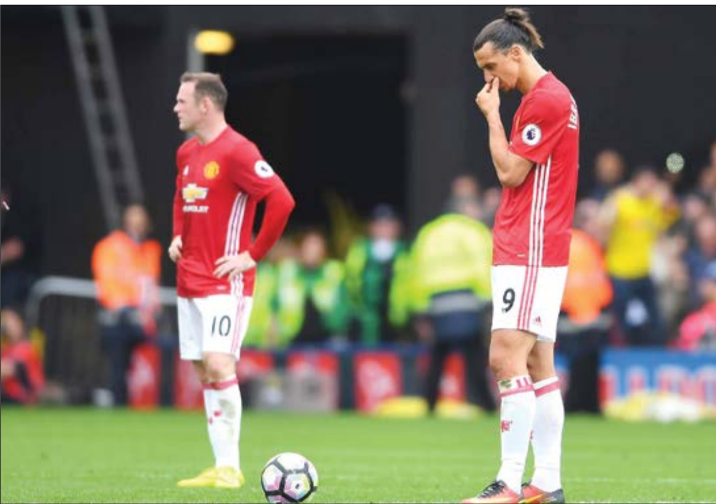
تجوم المان مطالبون بالفوز

ريد بول سالزبورغ متذيل الترتيب كي يبقى ضمن دائرة المنافسين على إحدى بطاقتي التأهل. وعلى غرار شالكه، يبدو زينيت سان بطرسبرغ الروسي جاهزا لتحقيق فوز الـ16 في المجموعة الرابعة على حساب دونالك الأيرلندي، فيما يتوقع أن تكون مهمة شاختر داينتسك الأوكراني أصعب في الثامنة مقارنة مع مباراة الذهاب التي سحق بها وصيفه غنت البلجيكي بخماسية نظيفة.