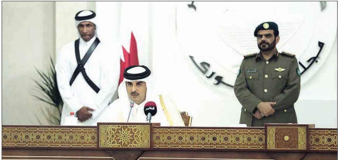
صاحب السمو الشيخ تميم بن حمد آل ثاني في خطابه السنوي بائنتاح دور الاعتقاد العادي الخامس والأربعين لمجلس الشورى أسس

الدوحة - وكالات: جدد أمير قطر صاحب السمو الشيخ تميم بن حمد آل ثاني التأكيد على دعم بلاده «لحل سياسي شامل وعادل ينهي معاناة الشعب السوري المنكوب ويضمن وحدة سورية واستقرارها». كما جدد أمير قطر في خطابه السنوي في افتتاح دور الاعتقاد العادي الخامس والأربعين لمجلس الشورى (البرلمان) الدعوة إلى حل الخلافات حول «أمن الخليج» بالحوار، قائلاً: «بالنسبة لأمن منطقة الخليج وانطلاقاً من مبادئنا الثابتة فإننا ندعو إلى حل الخلافات بالحوار الهادف والبناء في إطار الاحترام المتبادل وعدم التدخل في الشؤون الداخلية».