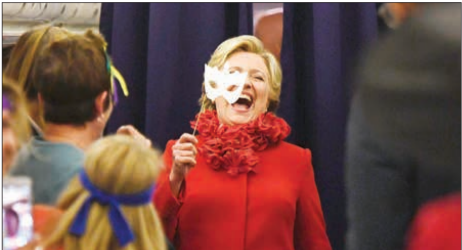
هيلاري كلينتون تمسك بقناع وهي مبتسمة على متن طائرة حملتها الرئاسية أمس الأول (إ.ف.ب)

واشنطن- وكالات: لم يشأ مدير مكتب التحقيقات الفيدرالي (إف بي آي) جيمس كومي القيام بأي مجازفة يمكن أن تُفسر شكوكاً بشأن نزاهته، لكن الواقع أنه وجد نفسه في موقع صعب للغاية لانتهامه بالتدخل في مسار الانتخابات الرئاسية قبل أيام قليلة من موعدهما. فقد أعلن كومي الجمعة في رسالة مقتضبة إلى مسؤولي الكونغرس، عن اكتشاف قد يقود إلى تطور جديد في التحقيق حول استخدام المرشحة الديموقراطية هيلاري كلينتون خادماً خاصاً لمراسلاتها الإلكترونية حين كانت وزيرة للخارجية، موضحاً في الرسالة أنه لا يعلم إن كان اكتشاف هذه الرسائل الإلكترونية الجديدة سيحلل عناصر مهمة. وفي رسالة أخرى وجهها إلى موظفي إف بي آي، أورد أنه شعر بأنه «ملزم» بإبلاغ الكونغرس بالأمر «نظراً إلى أنني أفدت عدة مرات في الأشهر الأخيرة أننا أنهينا تحقيقنا». والواقع أنه أثار عاصفة هائلة قبل أيام قليلة من انتخابات 8 نوفمبر. وسارع المرشح الجمهوري للبيت الأبيض دونالد ترامب الذي تقدمه منافسته الديموقراطية في استطلاعات الرأي، إلى استغلال هذا العنصر الجديد بالرغم من عدم توافر أي معلومات حوله، فحذر بان انتخاب كلينتون «سيفرق الدولة وبلادنا في أزمة دستورية»، مبدياً فحته بان كلينتون ستكون موضع ملاحقات قضائية. وبقي البيت الأبيض حذراً وتبني موقفاً محايداً، وقال جوش إيرنست المتحدث باسم الرئيس باراك أوباما «لن ننتقد المدير كومي، كما لن نأفح عنه». وأضاف أن الرئيس الذي عين كومي، وهو جمهوري غير مدرج على قوائم الحزب، في 2013 لعشر سنوات، «مازال يقف في قدرته على إنجاز