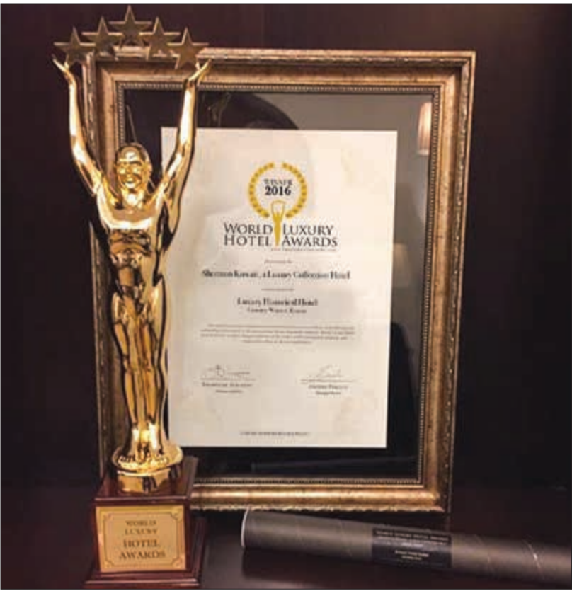
جائزة «فندق الكويت العريق»