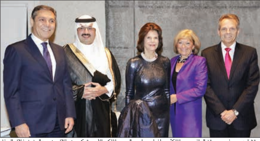
ريتشارد جروفيس ومعتز الرفاعي مع الملكة سيلفيا وصاحب السمو الملكي الامير تركي بن طلال بن عبدالعزيز خلال الحفل

عن اعتران البنك الأهلي المتحد بالمشاركة بالرعاية الذهبية لهذا الحفل الذي أقيم بهدف خيري يمس برسالته كل أفراد المجتمع دون استثناء، ويتطلع إلى خلق حالة من الوعي العام في أوساط الشباب لمنع انجرافهم نحو آفة المخدرات، مؤكداً أن أهداف مؤسسة مينتور تتوافق مع الدور الاجتماعي للبنك الأهلي المتحد وحرصه على وضع الشباب في مقدمة أولوياته.