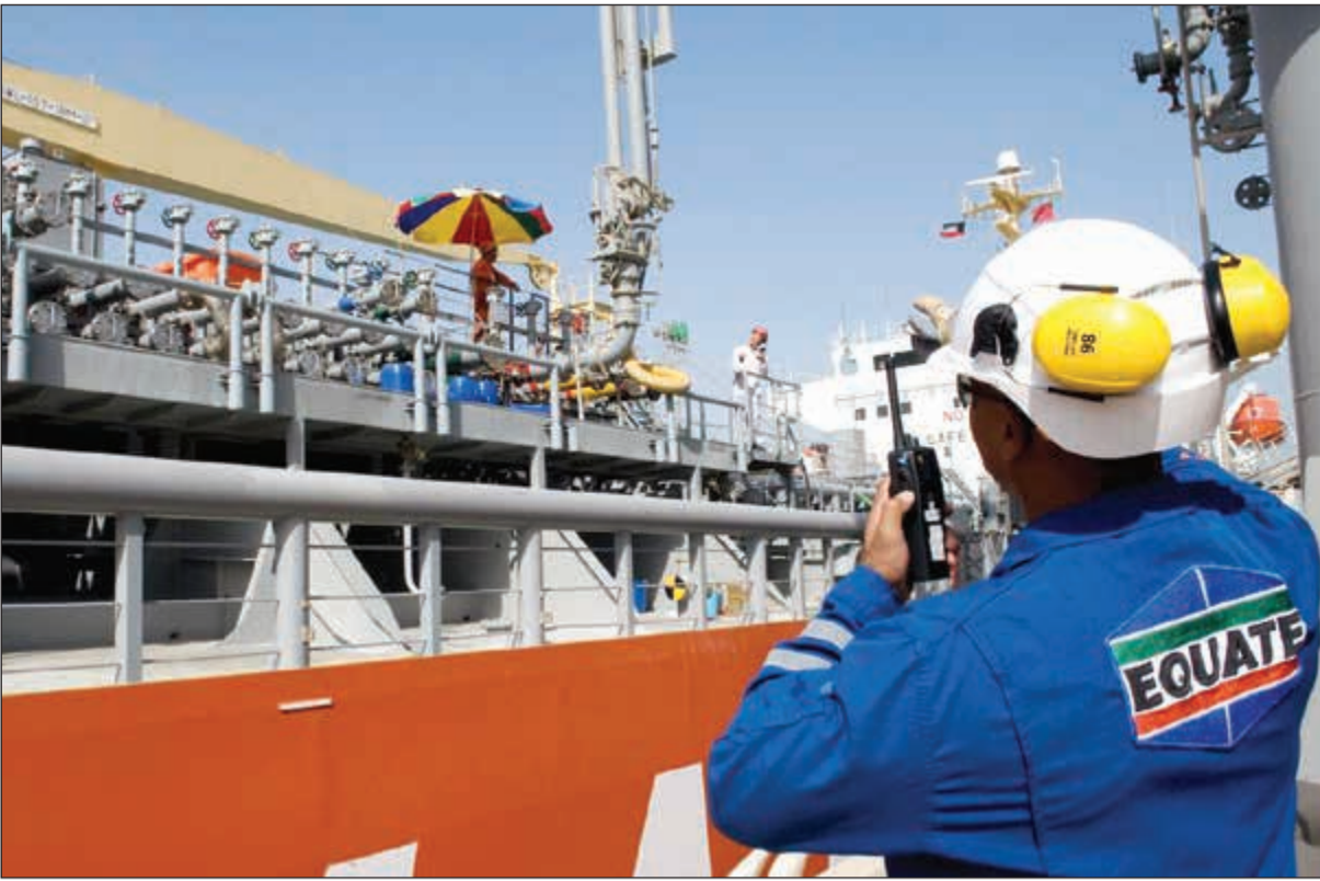
سندات ايكويت تلقي تغطية جيدة بفضل ادائها وتوسعاتها العالمية